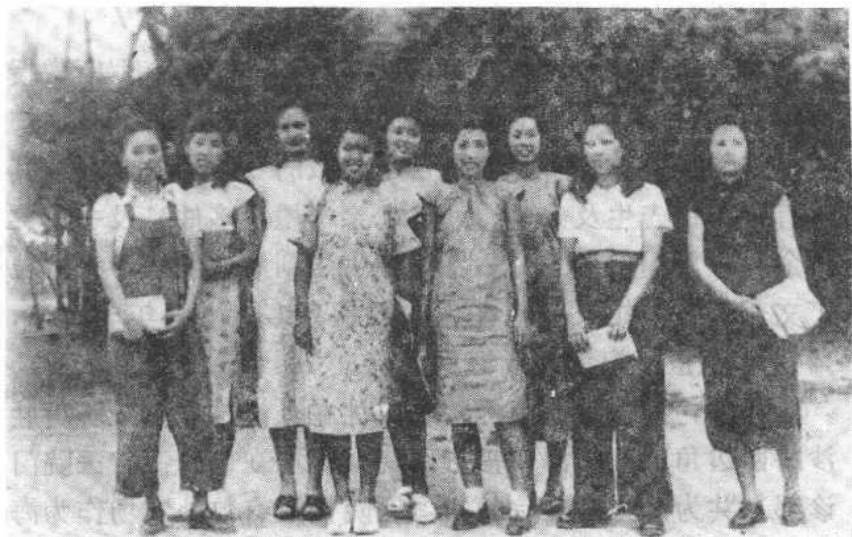
私立海南大学部分女生