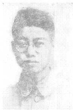
⑥ 山西杰出的共产党 员、大革命时期的学 生领袖王运同志