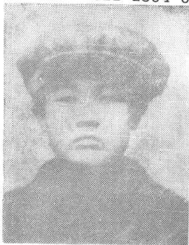
②一九二二年中国社会主义青年团太原地方执行委员会书记，正太铁路工人运动的组织者贺昌同志