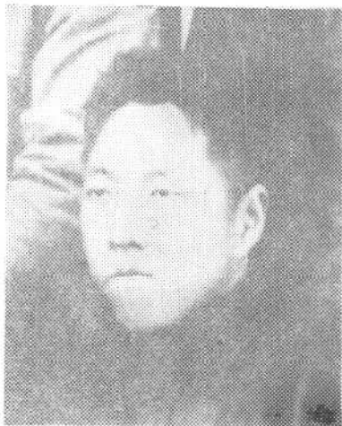
④中共太原支部第一任书记张叔平同志