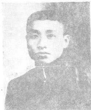
⑨一九三一年中共山西省委书记、红二十四军的组织者刘天章同志