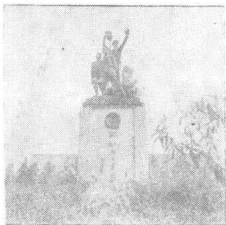
②② 太原人民公园烈士纪念碑