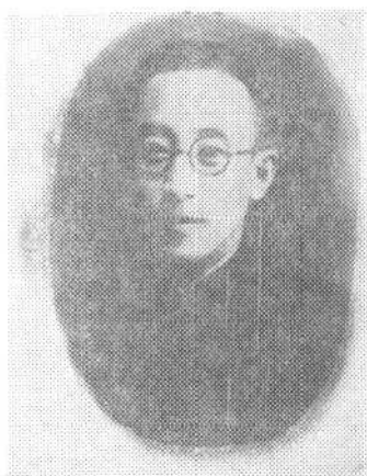
⑱一九三七年中共山西省委书记张友清同志