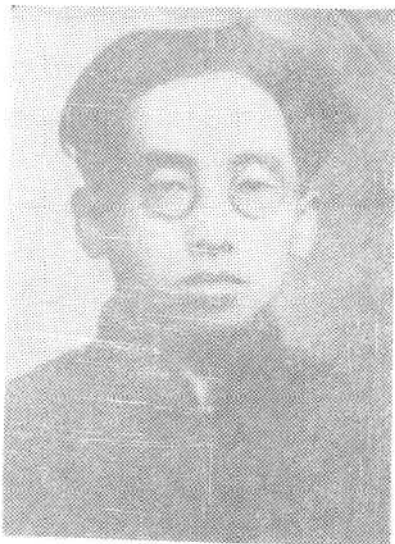
①太原党组织创始人高君宇同志