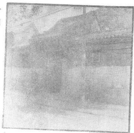
⑯太原市新民街二十三号，太原八路军办事处