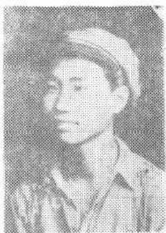
②① 解放战争时期，优秀共产党员、太原进山中学学生领袖齐亚烈士