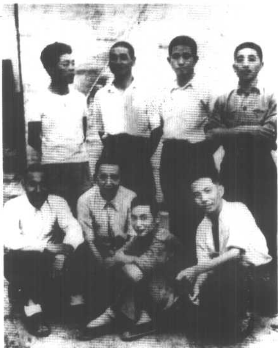
1947年，晋冀鲁豫野战军九纵领导同志合影。后排右起：秦基伟、黄镇、安仲源；前排右起：黄新友、何正文、袁子钦、鲁瑞林。