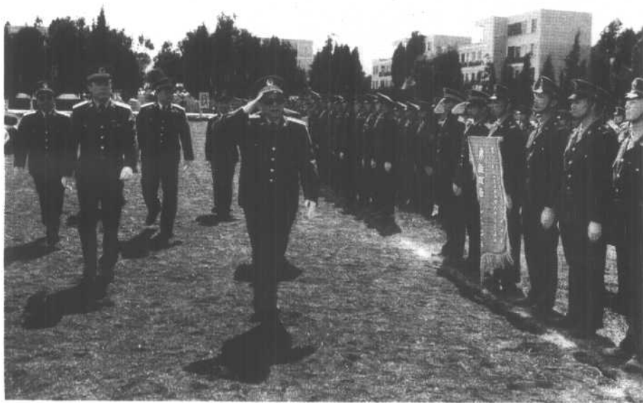
1991年9月，视察成都军区驻云南某部。