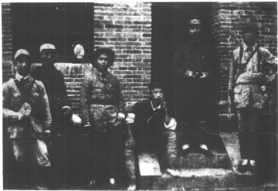
1945年收复河北临城时，在县城耶稣教堂门前合影。右二为秦基伟。