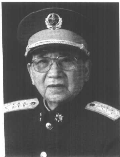
1988年9月，被授予上将军衔。时任中共中央政治局委员、军委委员、国务委员兼国防部长。