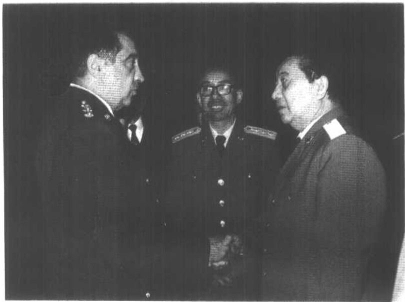
任国务委员兼国防部长期间，在北京会见外宾。