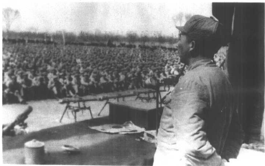
1948年11月，淮海战役前夕，给部队作动员报告。