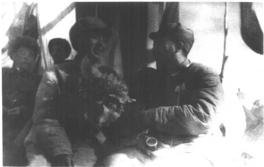
与英模人物亲切交谈。