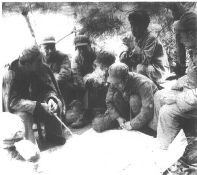
案。 1951年3月，在十五军指挥所研究歼敌方案。左一为秦基伟，左二为副军长周发田。