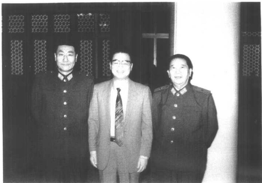
1988年夏，与李鹏总理合影。右起：秦基伟、李鹏、徐惠滋。