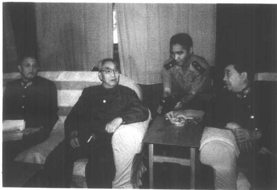
向徐向前元帅汇报红四方面军战史修改情况。前排左起：洪学智、徐向前、秦基伟。