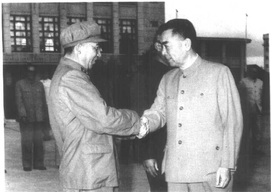
六十年代，在昆明机场欢迎周恩来总理出访归来。