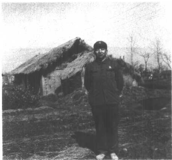
“文革”期间， 下放劳动在湖南某 农场。身后是居住 的茅屋。