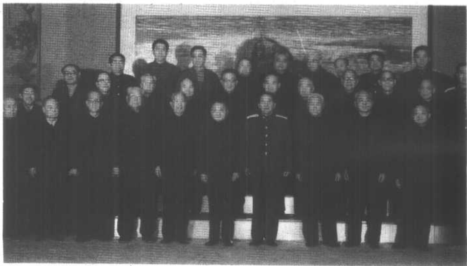
1989年11月20日，邓小平同志会见二野战史编辑修定人员。前排左起：戎子和、聂真、李雪峰、陈锡联、宋任穷、邓小平、秦基伟、陈再道、杜义德、刘志坚。