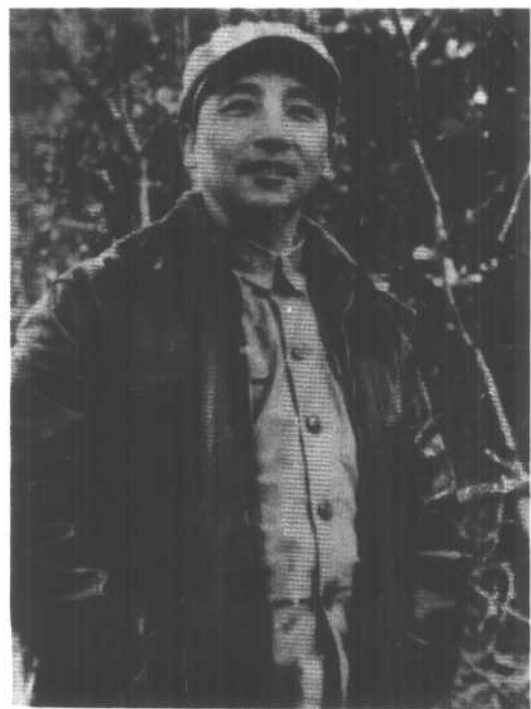
抗美援朝时期，任中国人民志愿军第十五军军长。