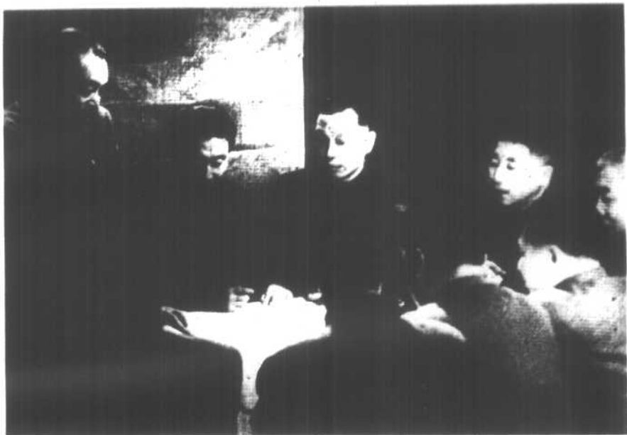
1951年春，参加部署第五次战役的一次作战会议。正面左起：彭德怀、解方、李志民、秦基伟、宋时轮。