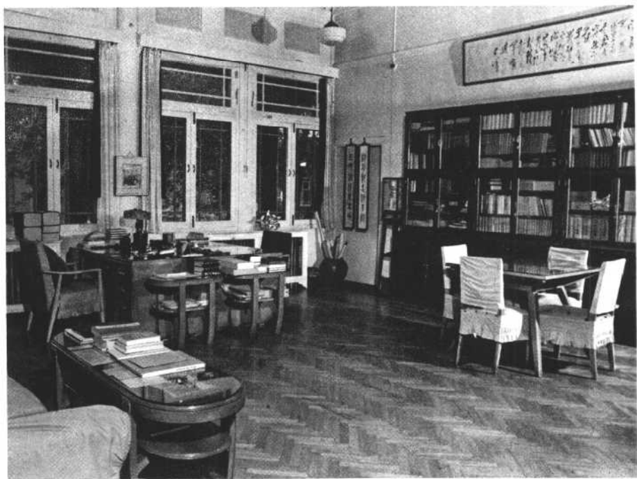
北京前海西街十八号故居书房