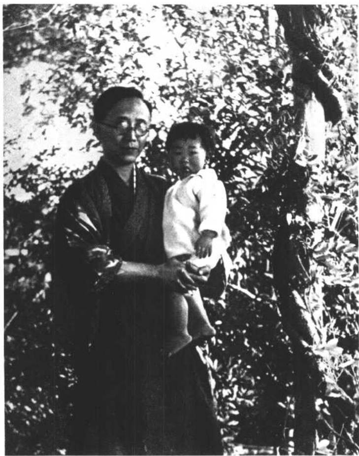
一九三三年在日本