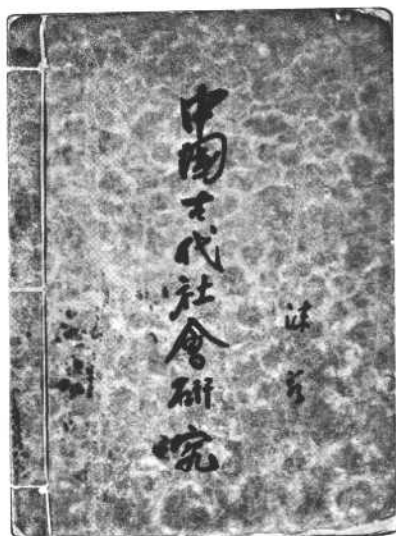
《中国古代社会研究》 一九三〇年三月上海 联合书店初版本书影