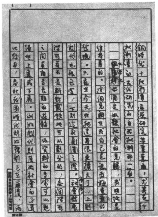
《中国古代社会研究· 后记》手稿之一页