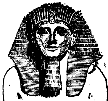
图 特摩斯三世(Thutmose, Tutmosis, 大约公元前1504—1450在位),古埃及新王国时代第18王朝(公元前1570—1320)的第五位国王。他是图特摩斯二世王妃伊西丝所生,少年时代曾在卡尔那克的阿蒙神庙做过小僧侣。

公元前1504年,图特摩斯二世去世。王后哈特舍普苏特有女无子,因而王妃伊西丝之子,大约10岁的图特摩斯(与父同名),在阿蒙神庙僧侣的支持下,继承了王位,是为三世。图特摩斯三世与哈特舍普苏特王后之女,他的同父异母姐妹涅菲鲁勒订婚,哈特舍普苏特王后则成为他的摄政者。