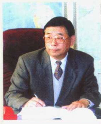
中国民用航空总局局长 刘剑锋