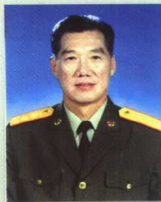
中国人民解放军 总后勤部原副部长 左建昌中将