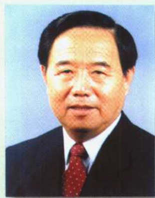
铁道部部长 傅志寰