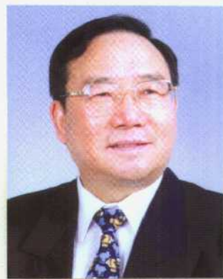
信息产业部部长 吴基传