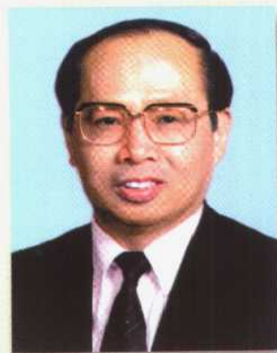
交通部部长 黄镇东