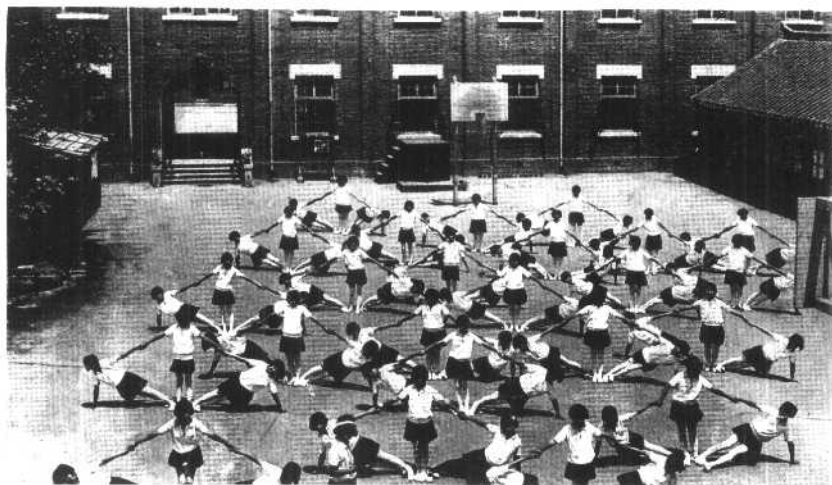
1929年奉天女子工科学学校课间操(叠罗汉)