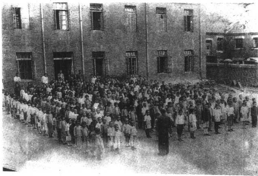
奉天贫儿学校东分校