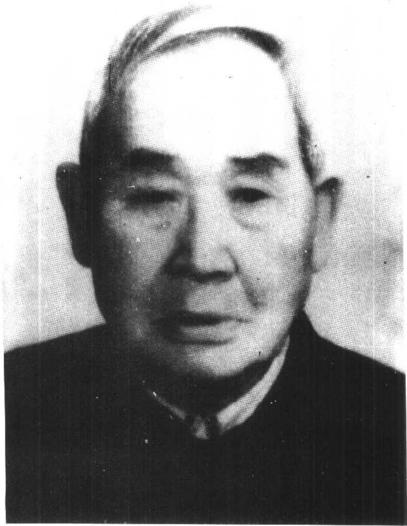
大东区第一任区长王琦同志