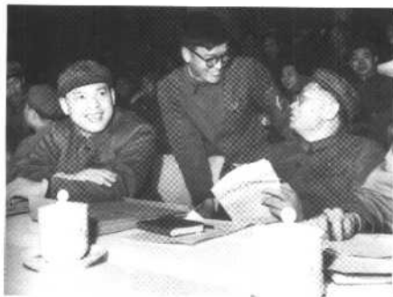
“文革”中姚文元（右3） 和蒯大富等造反派在大会 主席台上。