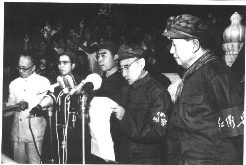
1966年9月15日，毛泽东第三次接见红卫兵时，林彪在天安门城楼发表讲话，鼓动红卫兵“大破一切剥削阶级的旧思想、旧文化、旧风俗、旧习惯”，即所谓“破四旧”。

北京清华附中红卫兵的三篇论“造反”的文章受到毛泽东的赞扬，被全国各报转载，广为宣扬。