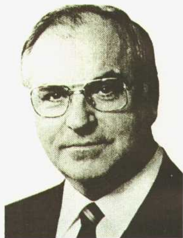
◇ 西德最后一位总理也即德国统一后第一位总理科尔。