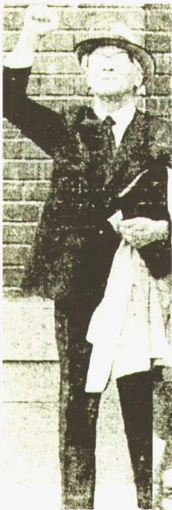
◇ 昂纳克被迫从智利使馆出来(1992年)。