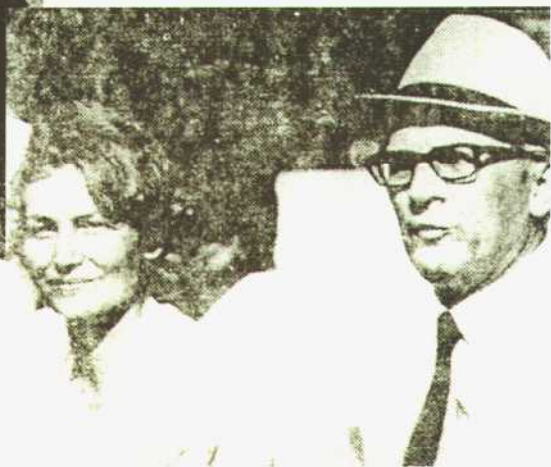
◇ 昂纳克和夫人玛戈特(1971年)。