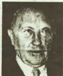
Differenzen um Wiener Öl

Die Regierung hat die Klage abgelehnt. Die Regierung hat die Klage abgelehnt. Die Regierung hat die Klage abgelehnt. Die Regierung hat die Klage abgelehnt.