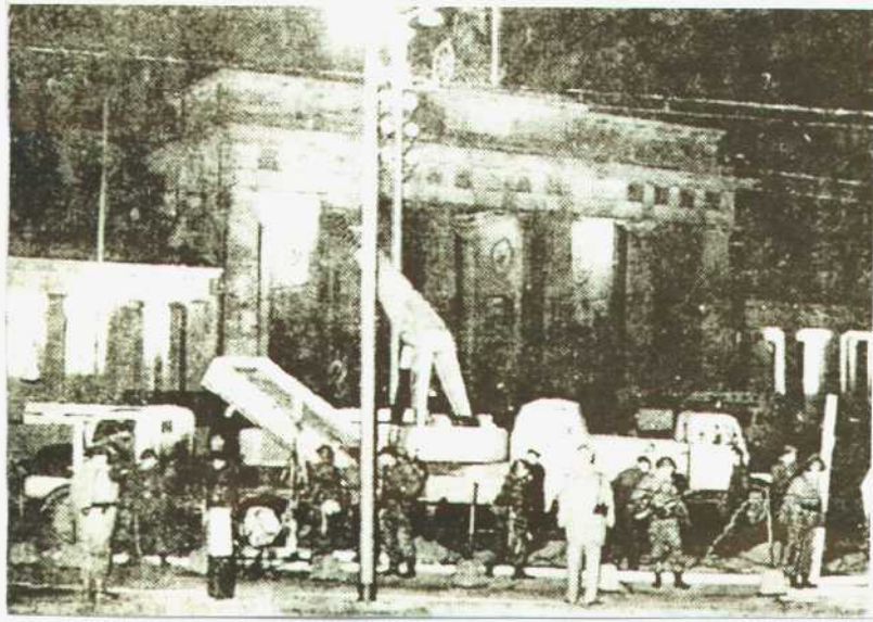
1961年8月13日在勃兰登堡修建柏林墙。