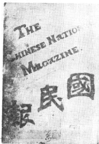
一九〇四年发行的 《国民报汇编》封面