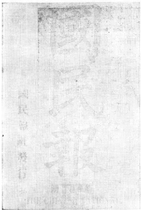
《国民报》第一期封面