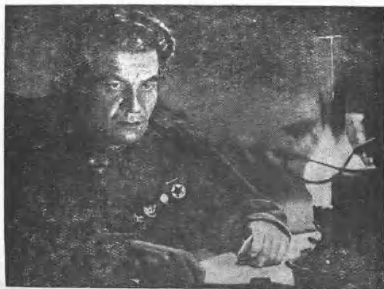
“斯大林格勒大血戰”