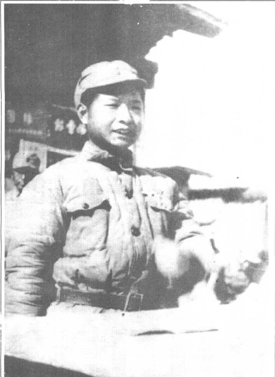
1937年冬，任抗日军政大学政治部副主任的胡耀邦在发表重要讲话