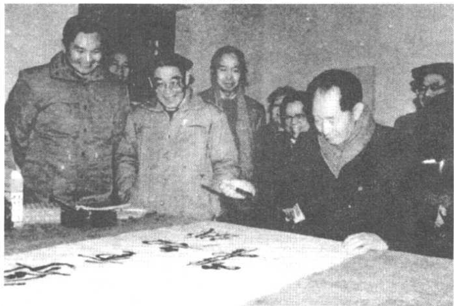
1989年1月，胡耀邦在参观长沙岳麓书院时，挥毫题写了“尊重知识”四个大字