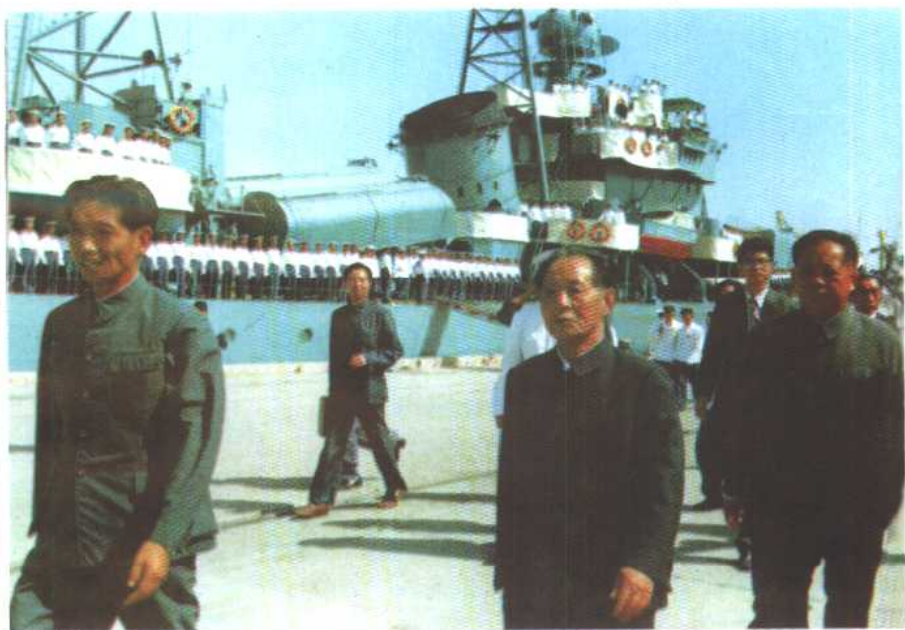
1983年9月24日，胡耀邦乘军舰视察旅顺口