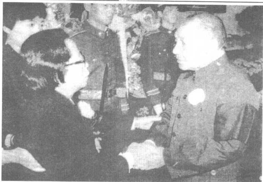
在胡耀邦同志的追悼会上，邓小平和胡耀邦的夫人李昭握手