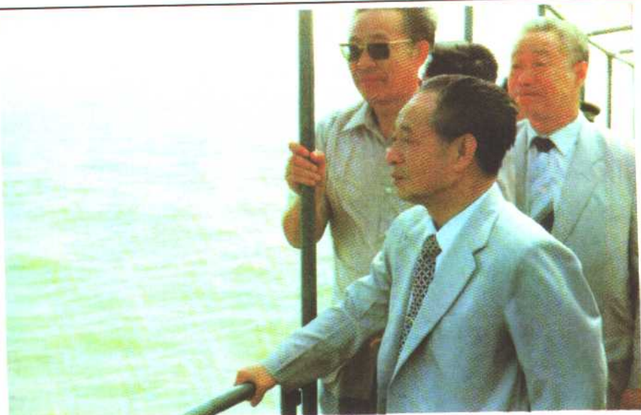
1984年5月，胡耀邦在视察珠海特区的途中