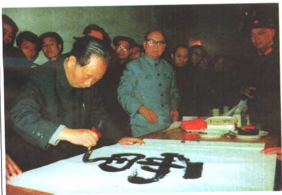
1984年6月29日，胡耀邦为白山水电站题字