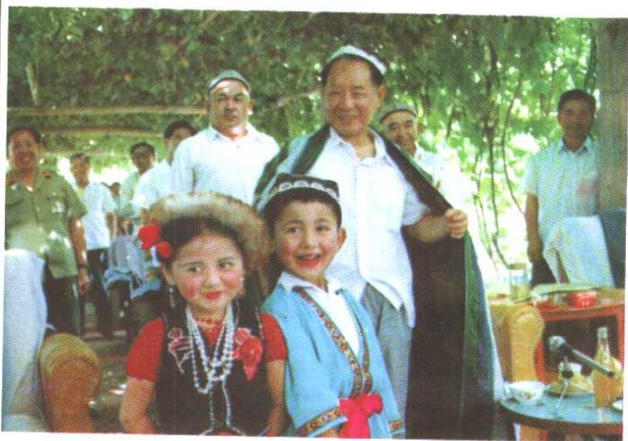
1985年7月，胡耀邦与维族儿童在一起