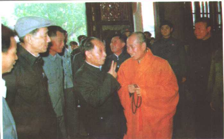
1984年2月5日，胡耀邦在广东省潮州开元寺与法师交谈