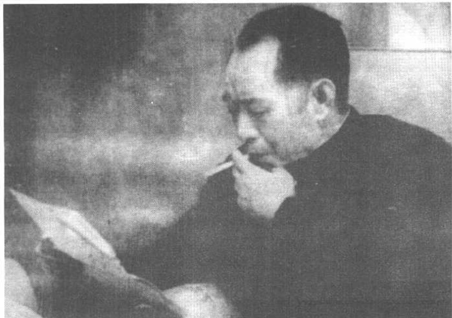
胡耀邦在阅读文件