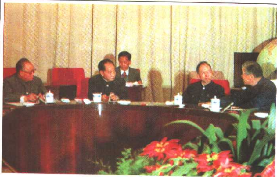
1985年3月13日，胡耀邦等与科技人员座谈