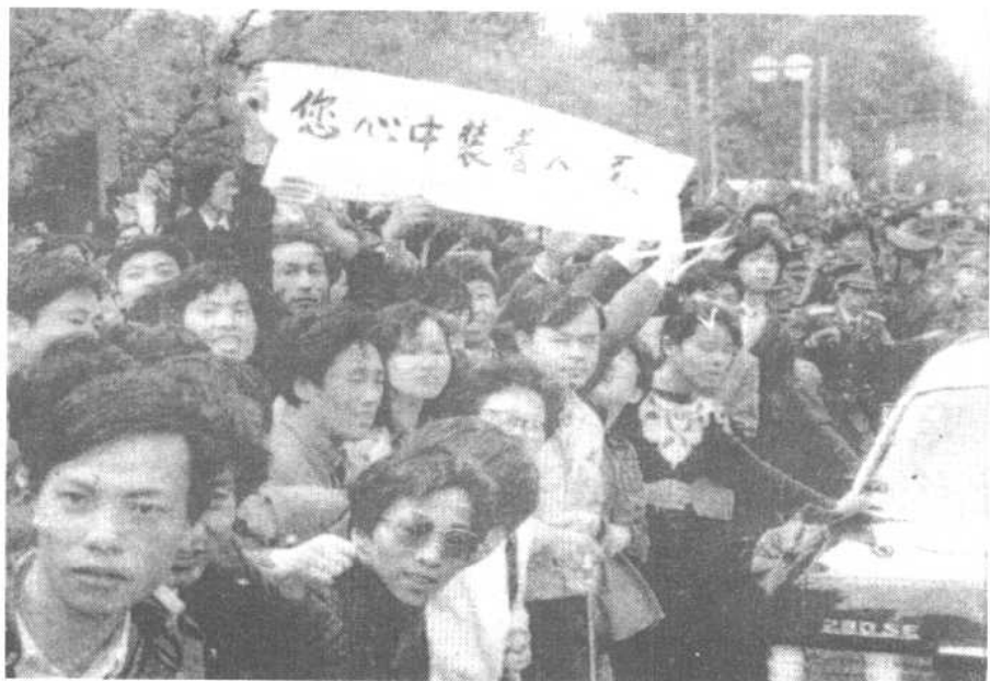
北京市民在十里长街迎送胡耀邦灵车