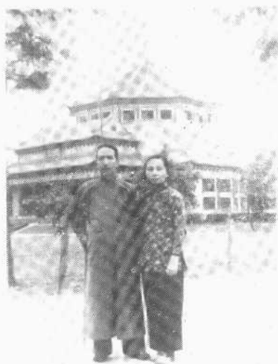
陳寅恪一九四七年在清華大學 新林院五十三號寓所書房