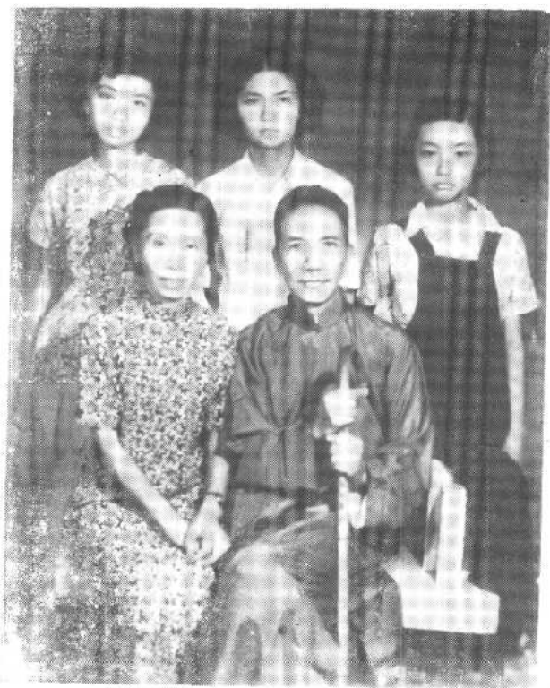
陳寅恪全家一九五〇年夏於廣州合影