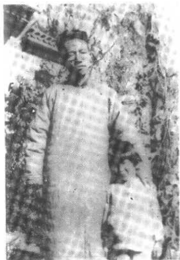
陳寅恪與長女流求一九三五 年於清華大學西院三十六號 寓所小照