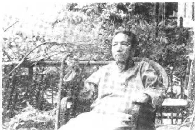
陳寅恪、唐筭夫婦一九五七年於廣州中山大學東南區一號寓所門前