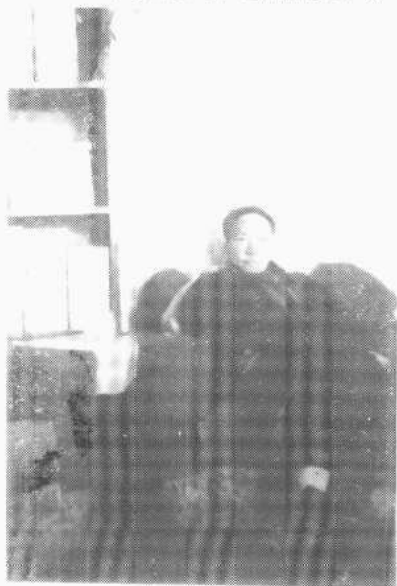
陳寅恪、唐筭夫婦一九五 一年在廣州中山紀念堂前