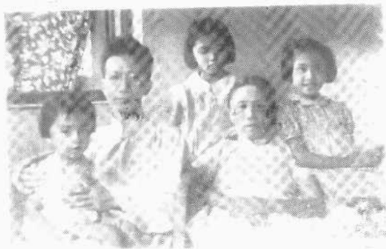
陳寅恪與家人一 九三九年於香港