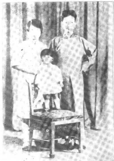
陳寅恪、唐筭夫婦與長女流求 一九三〇年於北平