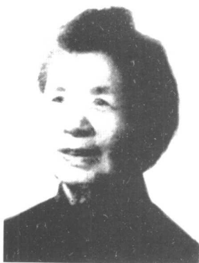
任弼时的夫人陈琼英