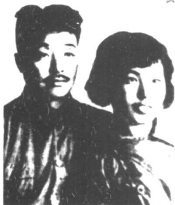
贺龙与夫人薛明在陕北