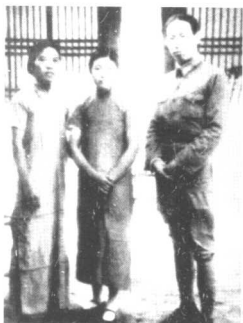
许光达与邹靖华在延安重逢时合影（1938年）。