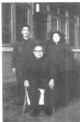
叶剑英元帅和长女叶楚梅，女婿邹家华在西山家中合影。他复出工作后，子女们也逐步解除监禁，回到了他的身边。