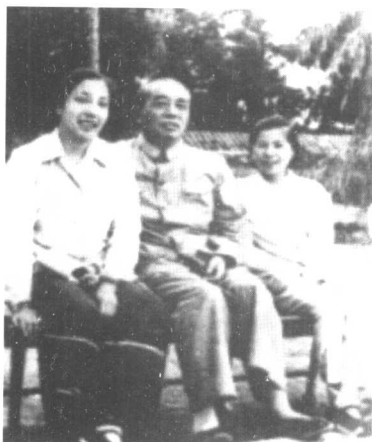
陈琼英与彭德怀、浦安修在一起。