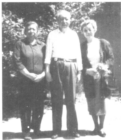
孙克悠与华国锋及其夫人合影。