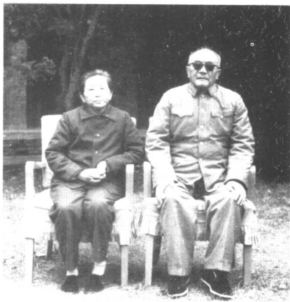
1981年，黄克诚与夫人唐棣华在玉泉山合影。