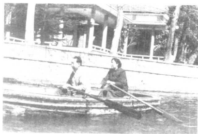
华国锋与老伴在中南海划船。