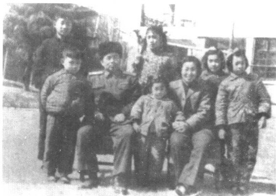
许世友和田普的全家福。