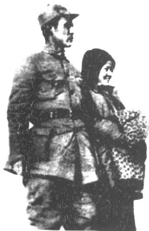
吕正操、刘沙于晋察冀张各庄（1943年）。