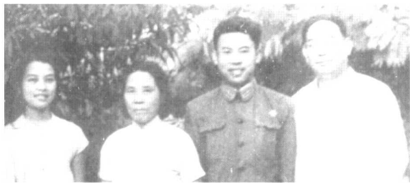
许光达、邹靖华与儿子、儿媳(1963年)