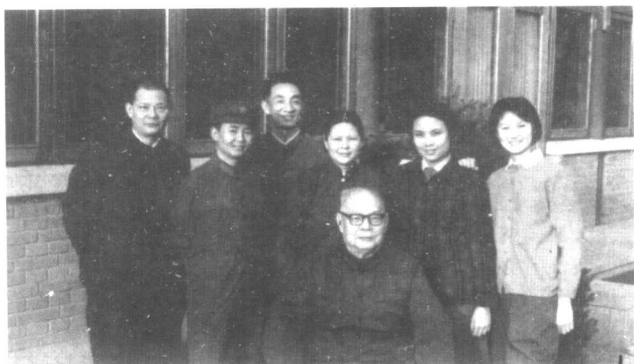
瞧叶帅这一家子，其乐融融。