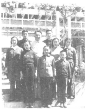
罗瑞卿郝治平全家福(1964年)