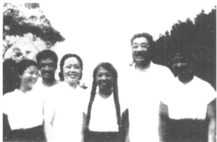
贺龙和他的家人合影