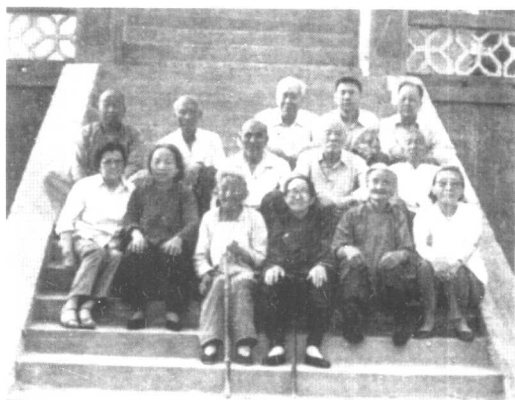
吕正操（中排右二）、刘沙（中排左一）和史立德（后排右三）、白力行（前排右一）与梅花惨案幸存者合影（1985年夏）。