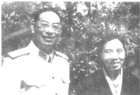
许光达与邹靖华(1955年).