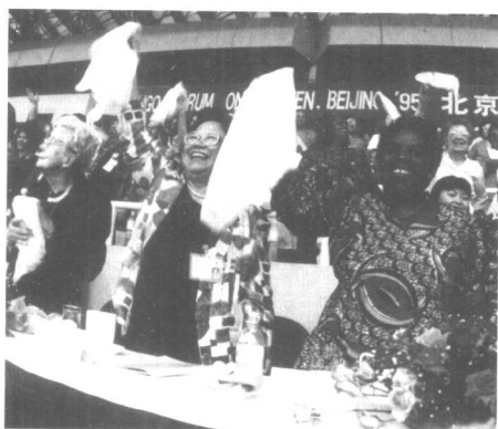
1995年9月4日，陈慕华在联合国第四次世界妇女大会上（中）。