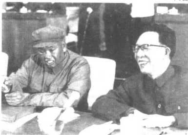
许世友和张春桥。别看他俩在一个画面里，心可不在一起。