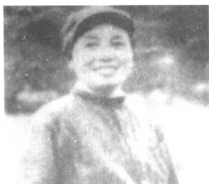
张琴秋1938年在延安担任抗日军政大学女生大队长