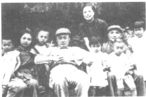
邓小平、卓琳和陈毅、张茜两家合影