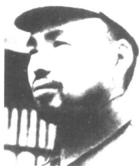
指挥反“扫荡”的山东八路军胶东军区司令员许世友。