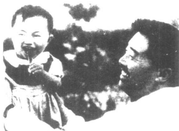
1941年8月，贺龙同志与他的儿子贺鹏飞在延安