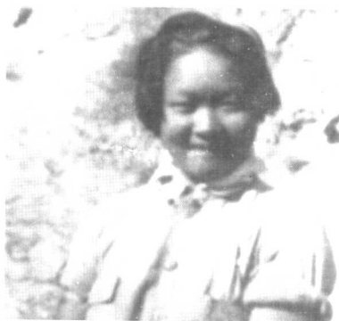
抗战时期，延安的“福尔摩斯”吕瓌。