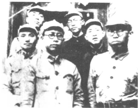
1936年，黄克诚在陕北与罗荣桓（右一）邓小平、杨尚昆等同志在一起。