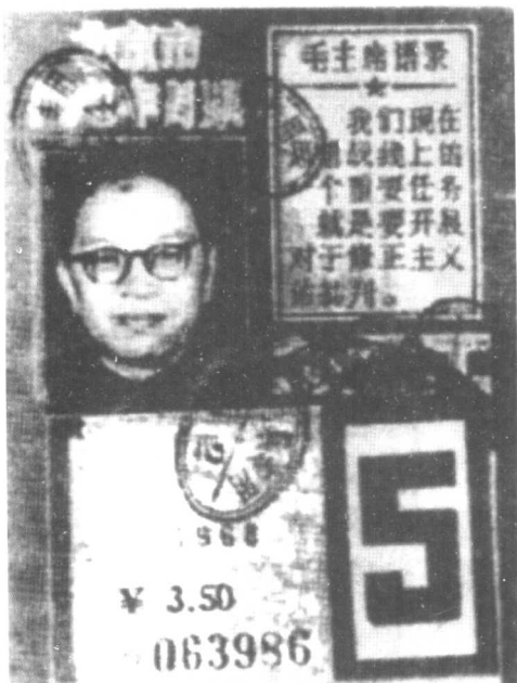
文革中，张闻天经常乘公共汽车到机关接受批斗。这是他使用过的汽车月票。