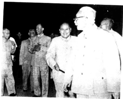
1959年8 月，黄炎培（右 二）任全国人大 访问蒙古人民共 和国代表团副团 长，与团长林伯 渠（右一）离京 时在车站同送行 者告别