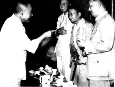
1957年6月，黄炎培（左一）在一届全国人大四次会议休息时间同梅兰芳、舒舍予（老舍）、华罗庚交谈