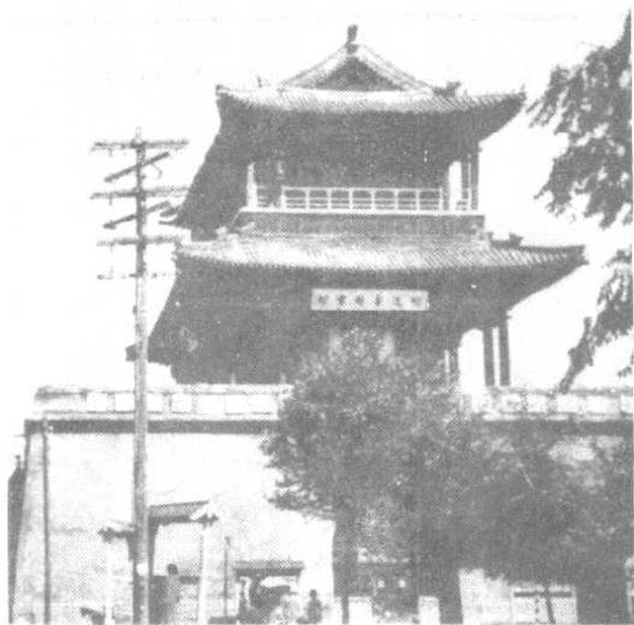
绥远城钟鼓楼（1959年春季拆除前拍摄）