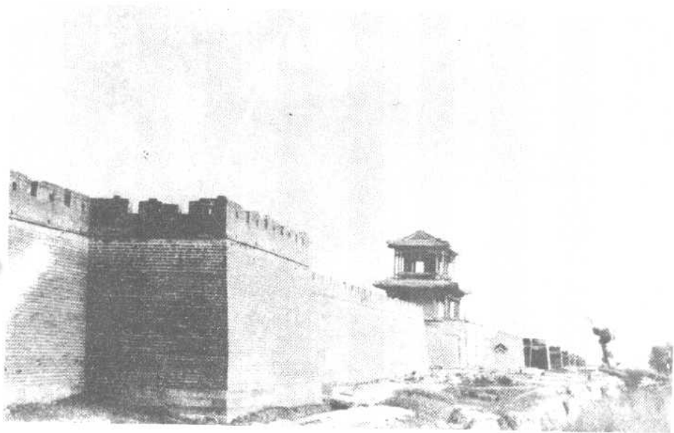
绥远城西门（阜安门）