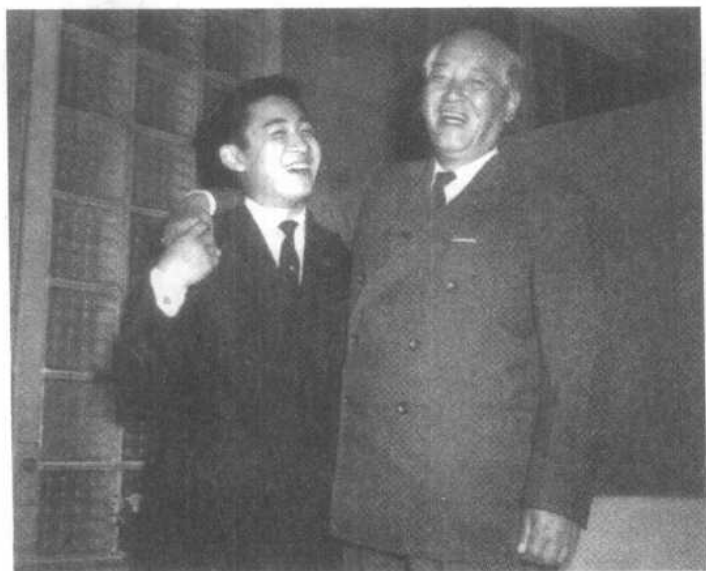
与创记录的人紧紧握手 桥本在35岁时当选为众议院议员，创全国最年轻议员记录 。当天，桥本与冈山地区连续当选次数最多的自民党议员星 岛二郎并肩站在一起，相互祝贺。1987年11月22日于 仓敷市。