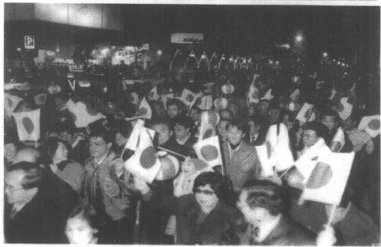
桥本当选首相的当晚支持桥本的群众手持日本国旗在东京街头游行欢呼。