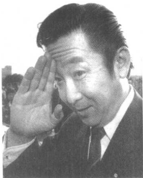
1991年，为声援胞弟桥本大二郎竞选高知县知事，桥本龙太郎亲临选区。