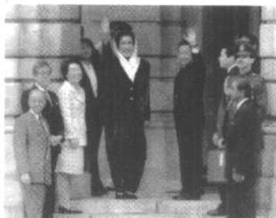
桥本在迎宾馆前迎接巴基斯坦首相布托。站在布托身边（左侧）的是久美子夫人。