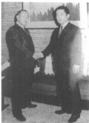
桥本作为已故前首相田中角荣的亲信露头角。

桥本与自民党的门面人物河野洋平、石原慎太郎结盟。为恢复党的威信，3人在大选中共同游说1993年7月5日于大阪，梅田。