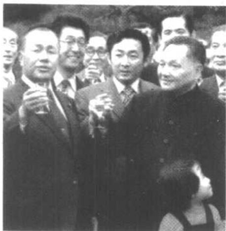
中国邓小平副总理（当时，右）访日时，拜会了日本前首相田中角荣（左），桥本也在场举杯共饮。1979年10月24日于东京田中宅中。