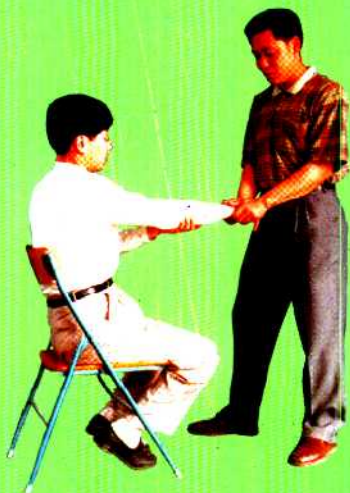
图 18 动势