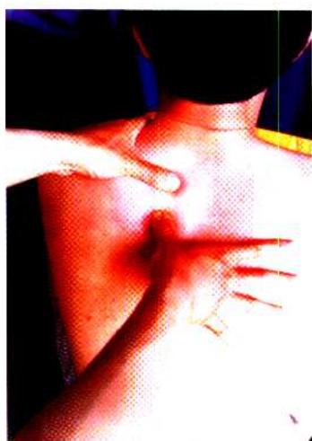
图 24 拉推法