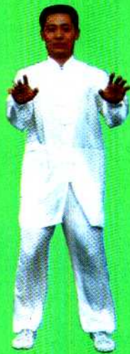
图 6 站功第六式