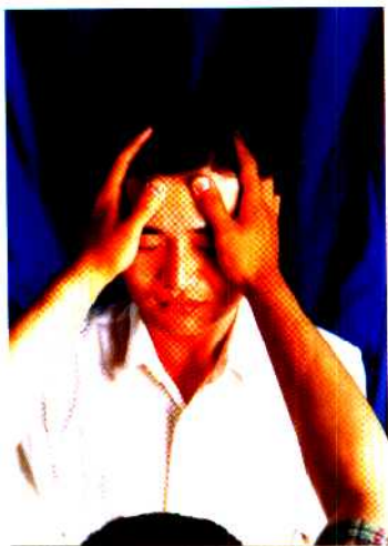
图 30 分阴阳法