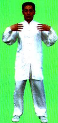
图 5 站功第五式