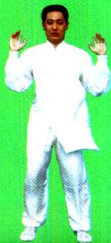
图 8 站功第八式