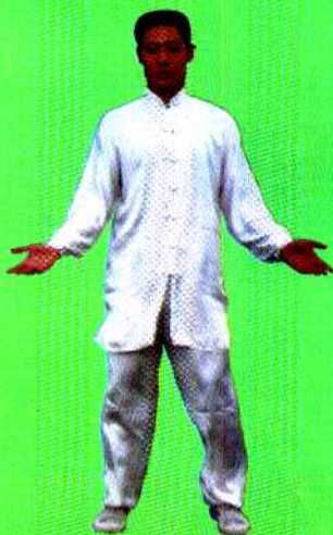
图 4 站功第四式