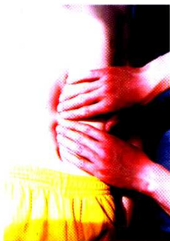
图 27 中指按法