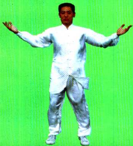
图 7 站功第七式