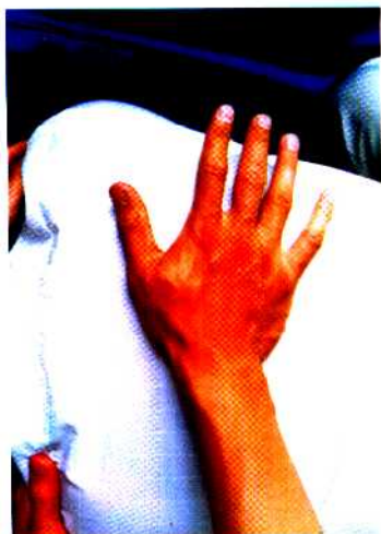
图 29 摩法