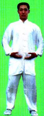
图 2 站功第二式