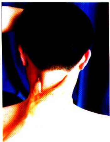
图 25 拿法