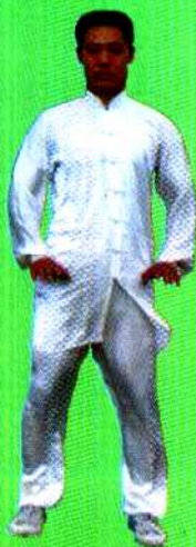
图 3 站功第三式