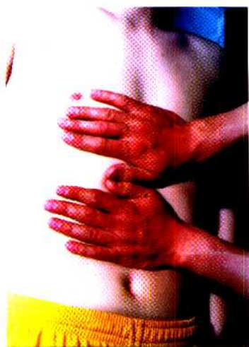
图 28 掌按法