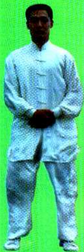
图 1 站功第一式