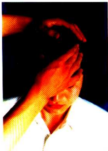
图 32 按头维法