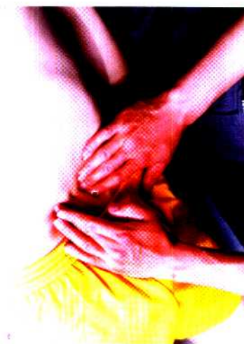
图 23 挤推法