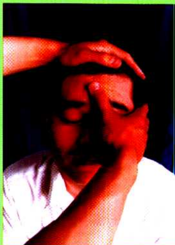
图 20 指直推法