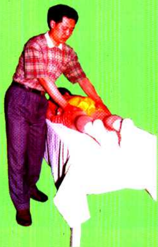
图 19 三体势