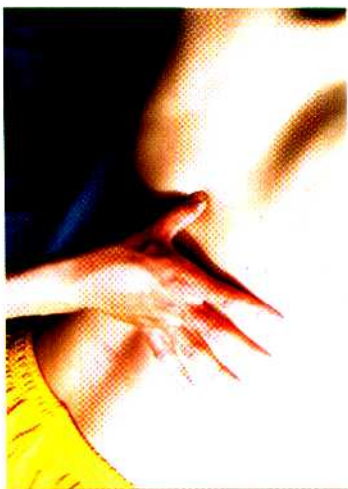
图 26 拇指按法