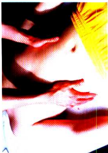
图 22 分推法