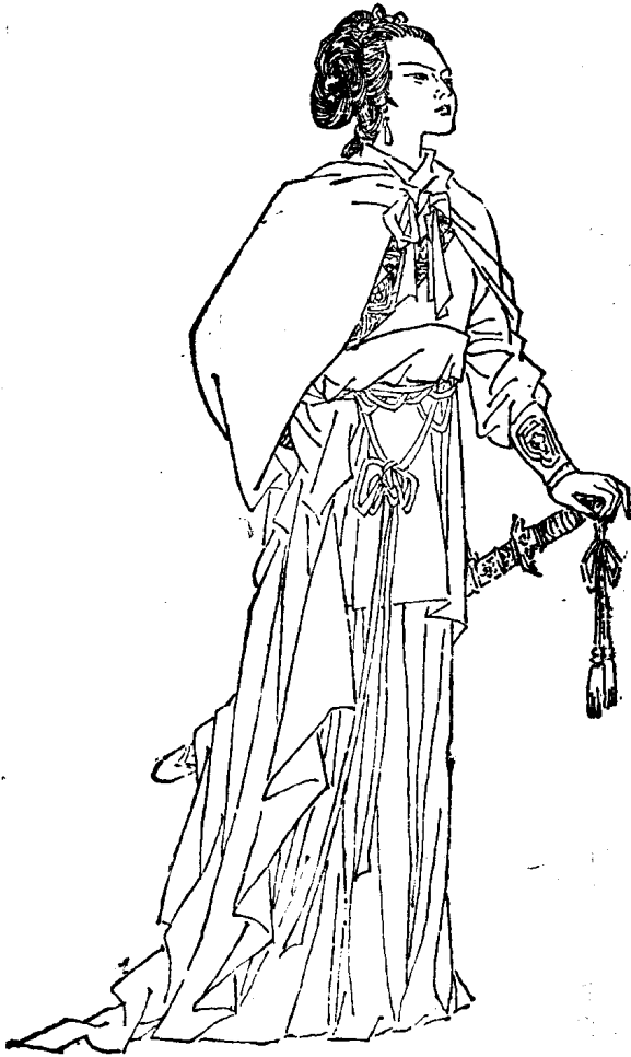
邓 威 娘