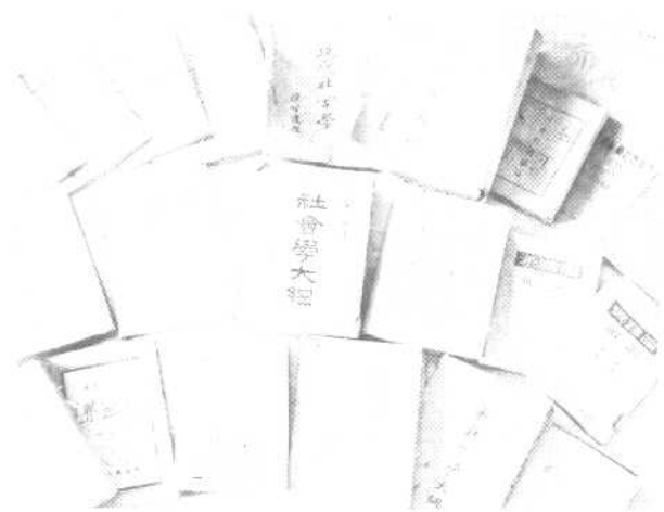
李达部分主要著作