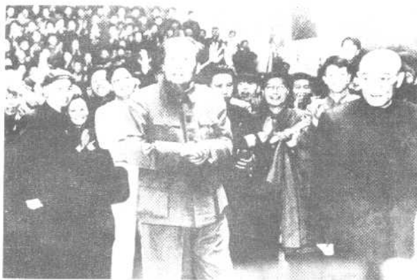
李达陪同毛泽东会见武汉科技界人士（一九五八年）