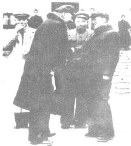
李达在湖南大学与前来视察的刘少奇握手，中立者为曹瑛（1952年）