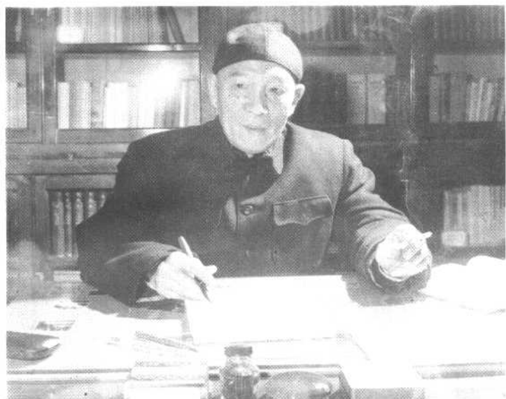
著名哲学家、中国哲学学会会长李达（1965年）