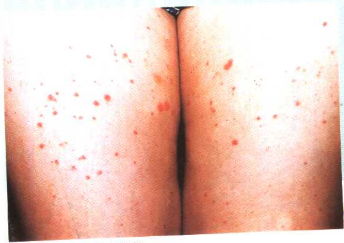
图 20 过敏性紫癜