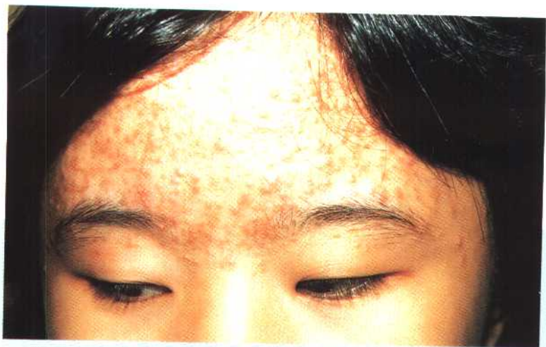
图 21 痤疮