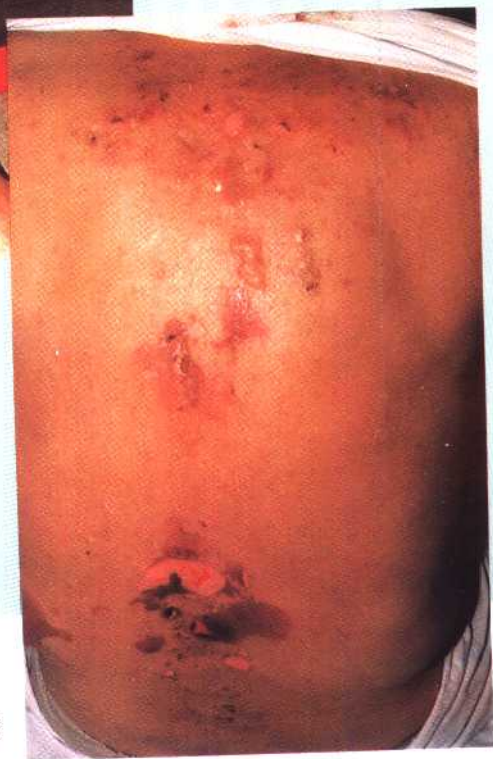
图 16 天疱疮