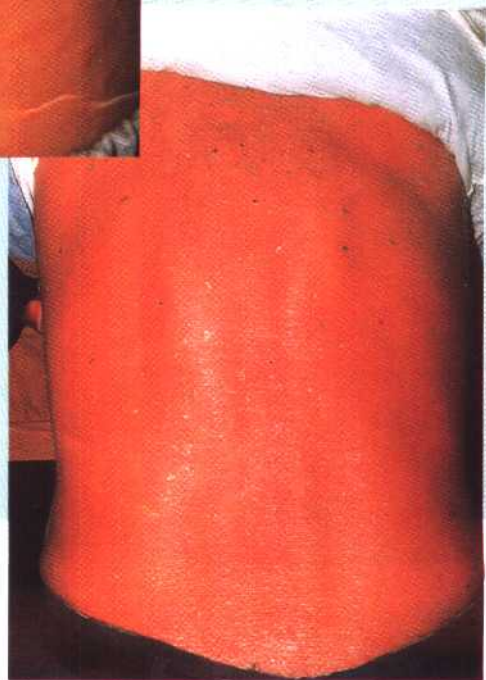
图 14 红皮病