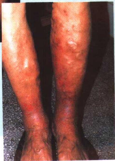
图 8 郁积性湿疹