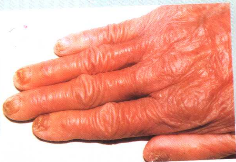
图 4 甲癣