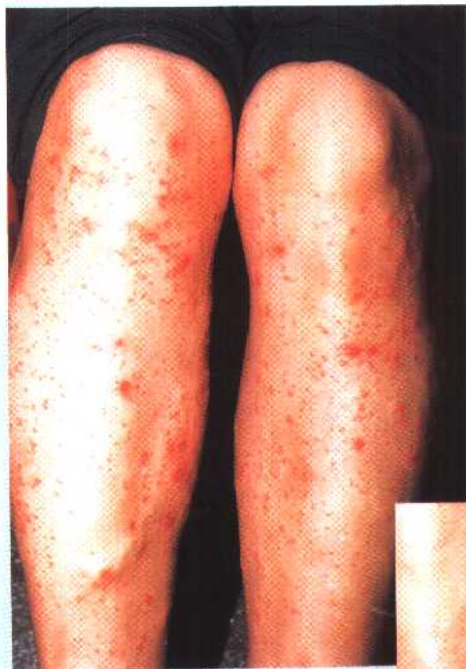
图 7 急性湿疹