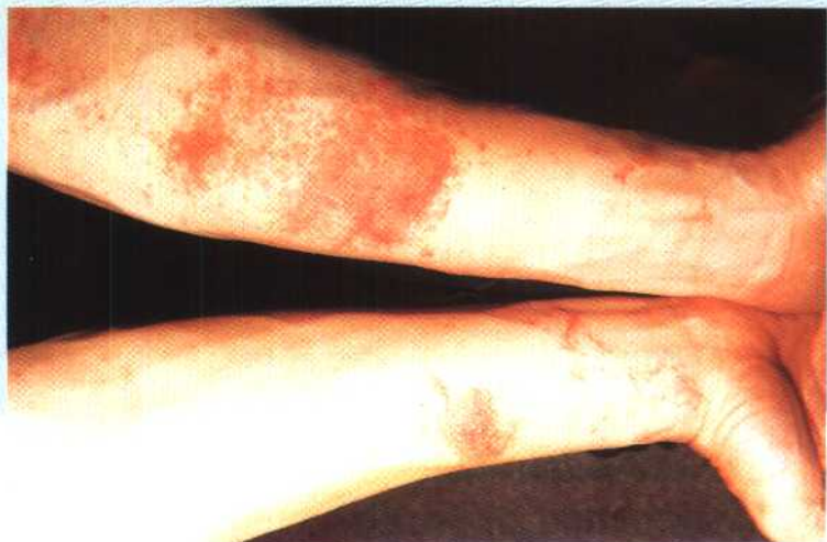
图 6 急性湿疹