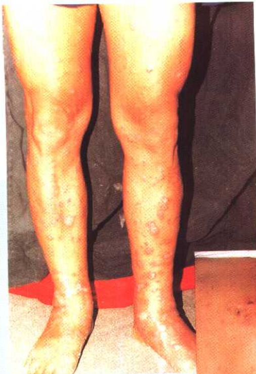
图 15 扁平苔藓