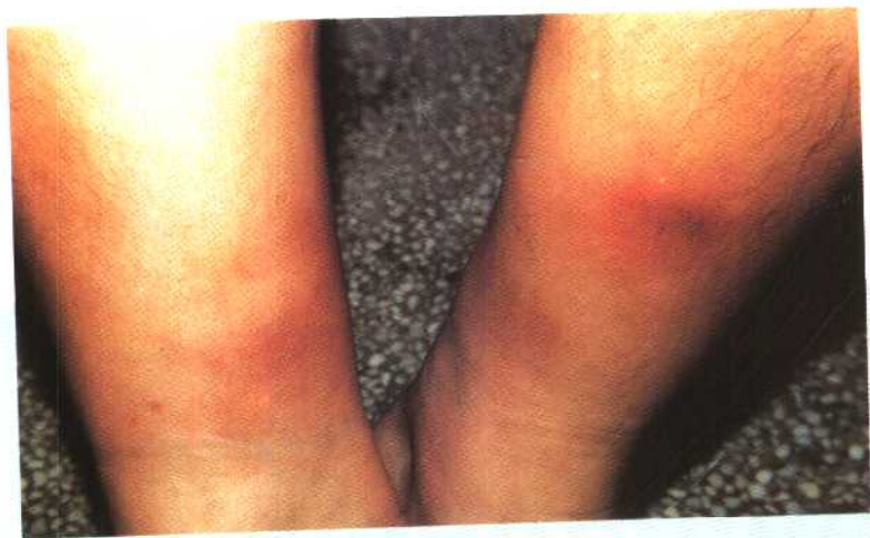
图 19 结节性红斑