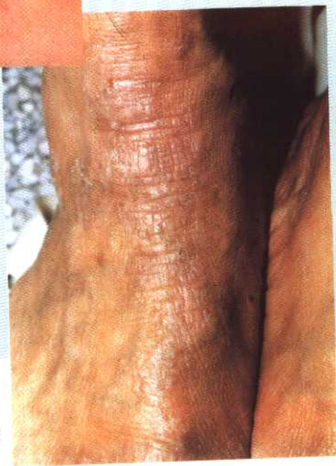
图 12 神经性皮炎