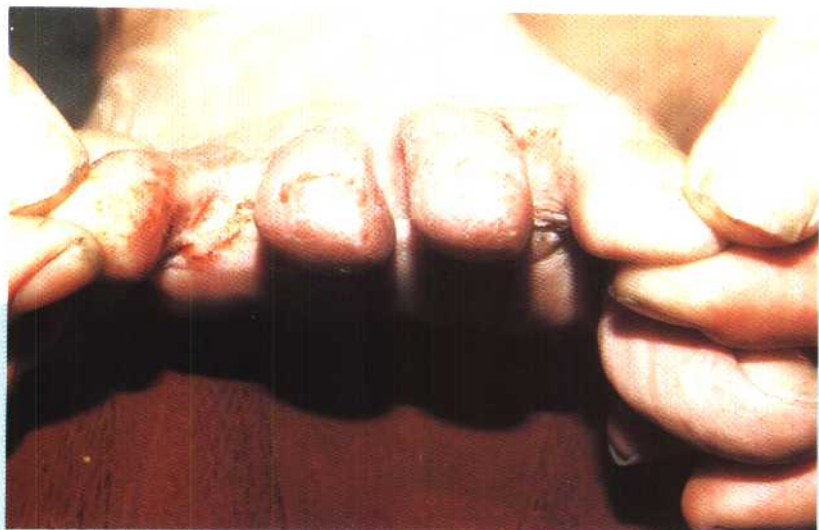
图 5 足癣