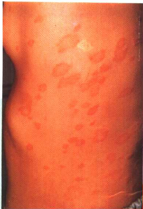
图 13 玫瑰糠疹