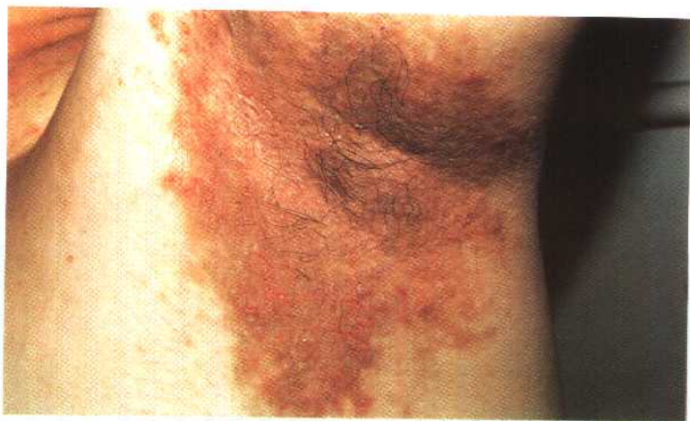
图 17 家族性良性慢性天疱疮