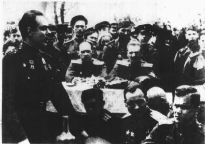
1944年， 勃列日涅夫(左一) 向指战员做 战前动员