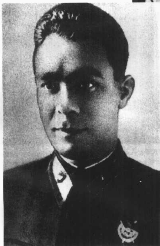
卫国战争初期,任第聂伯彼得罗夫斯克州委书记时的勃列日涅夫