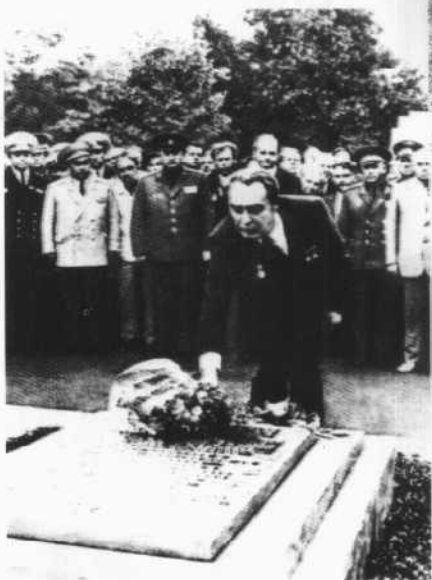
勃列日涅夫 向烈士墓献 花(1974年)