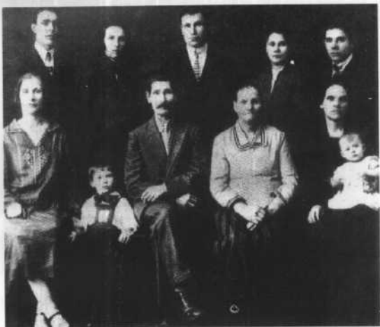
1930年的勃列日涅夫夫妇(后排左一、左二)与勃列日涅夫的父亲(前排左三)、母亲(左五)、祖母(左四)合影