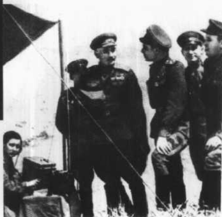
1943年勃列日涅夫(右三)和格列奇科(右四)在“小地”