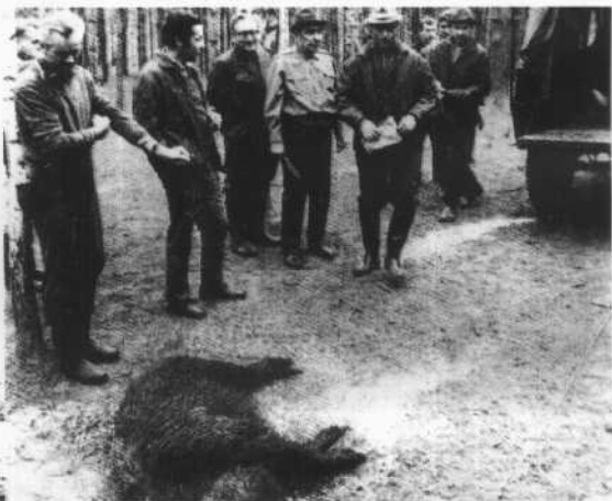
勃列日涅夫 (左四)与基辛格 (左三)在扎维多 沃狩猎场