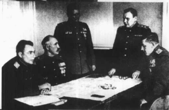
1945年4月， 勃列日涅夫(左一) 在第18集团军司 令部