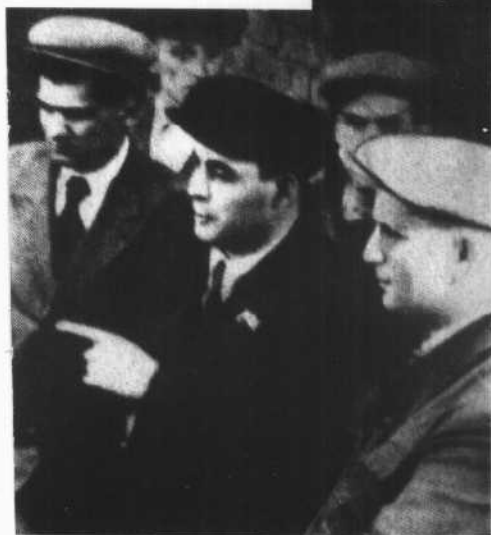
1946年8月，任扎波罗 热州委第一书记时的勃列日 涅夫(中)