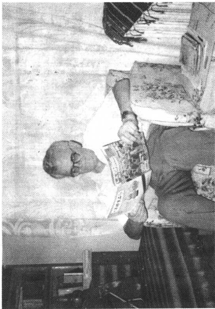
1997年8月，马利列在家中