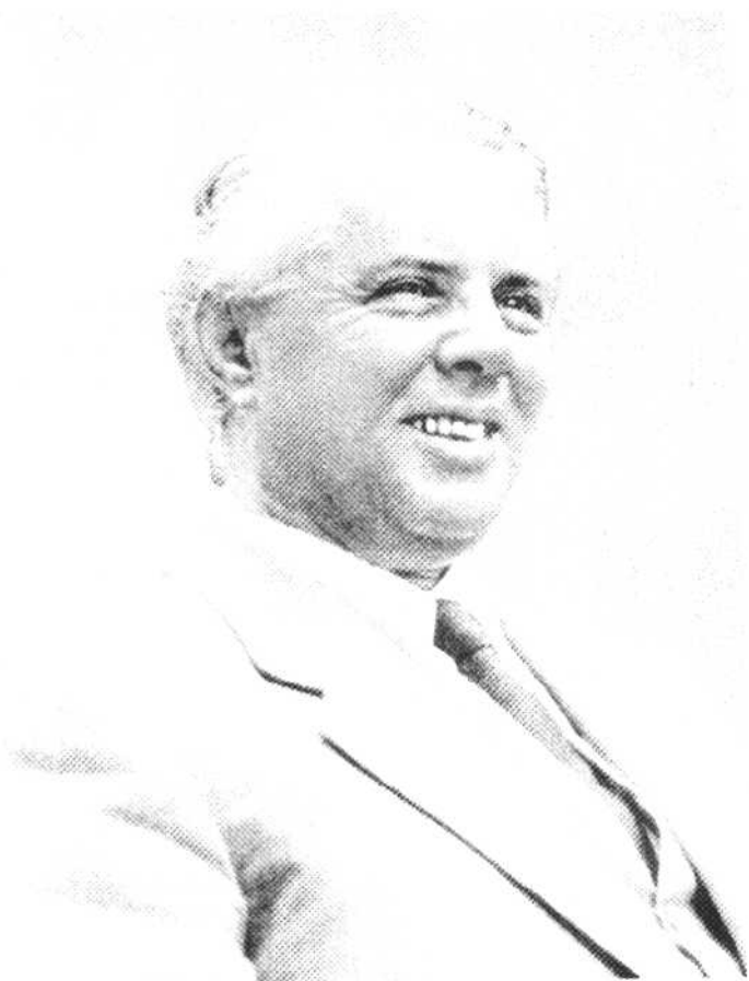
阿尔巴尼亚劳动党书记 恩维尔·霍查