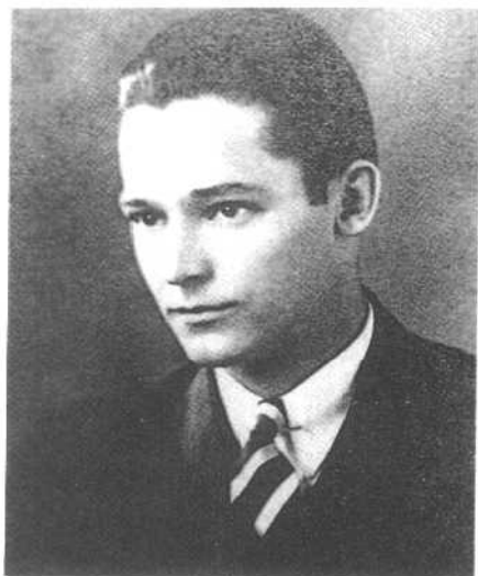
1936年我在密苏里州哥伦比亚希克曼高中时的毕业照。我的同学选我为“最多才多艺的男孩”。