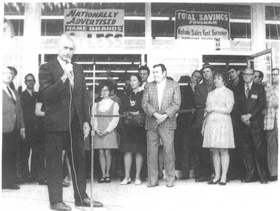
顾客不断涌入。1969年重回阿肯色州纽波特第十八家沃马特商店,特别令我心满意足。