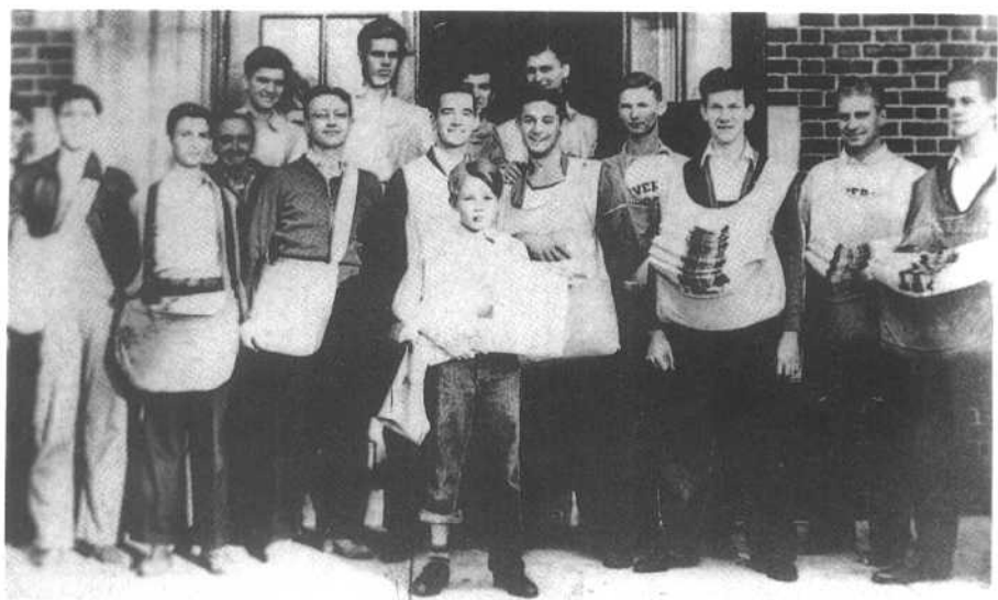
前排右四便是我，这些伙伴与我在密苏里大学里送报纸。