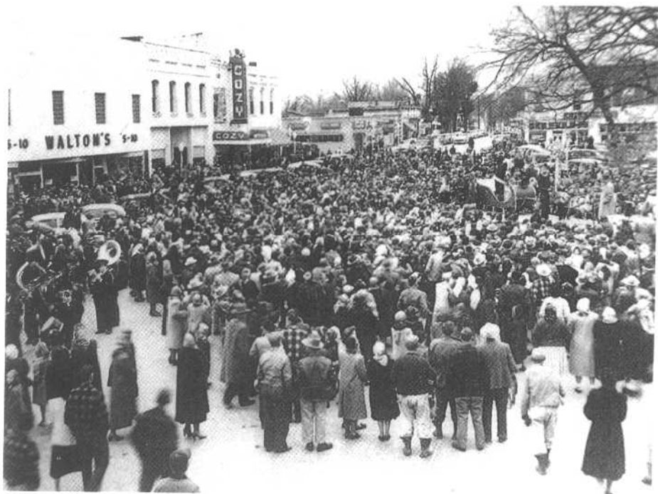
1951年圣诞老人降临本顿维尔的沃尔顿特价商店前的广场。