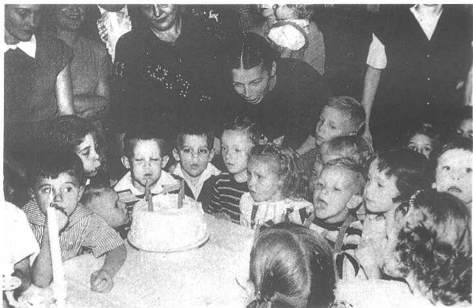
海伦邀请罗布的小朋友一起庆祝罗布4岁生日。