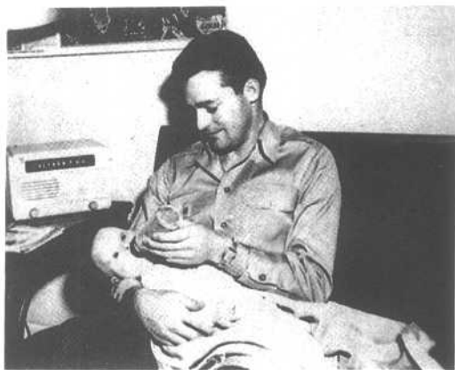
长子罗布和骄傲的父亲一起分享一段恬静时光。