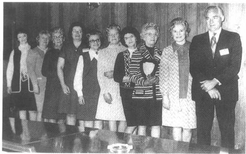
公司成立时,这群女士贡献最大。