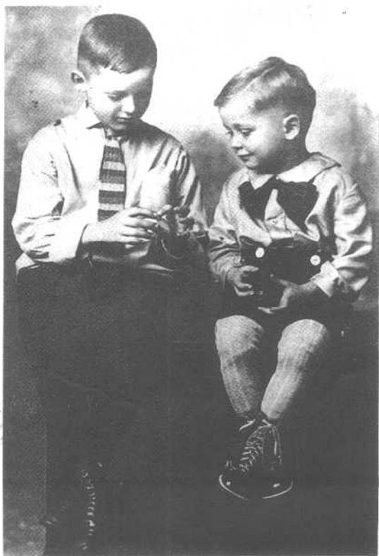
我向巴德解释某件东西，他耐心地听着我说。