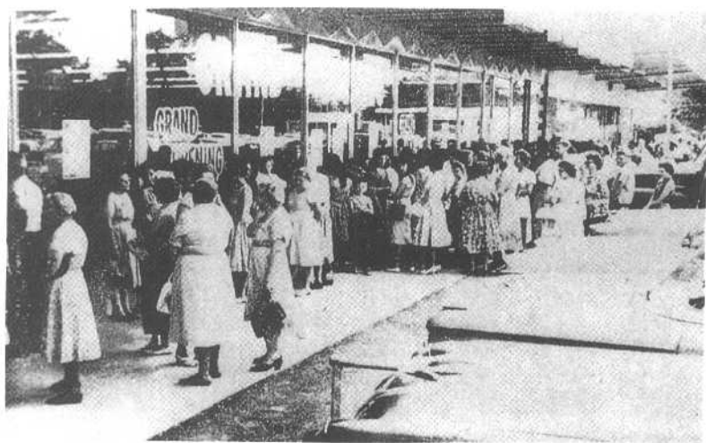
1962年7月2日第一家沃尔玛商店在阿肯色州罗杰斯开张。看到许多人排队等开门，我们松了一口气。