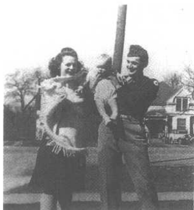
1944年罗布出生，我们一家人合影。