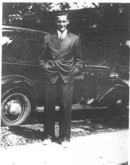
站在我第一部汽车前，觉得真是心满意足。这是一部二手车，但仍然闪亮耀眼。