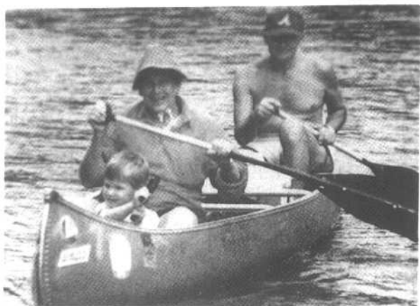
带着孙儿在布法罗河上划独木舟。