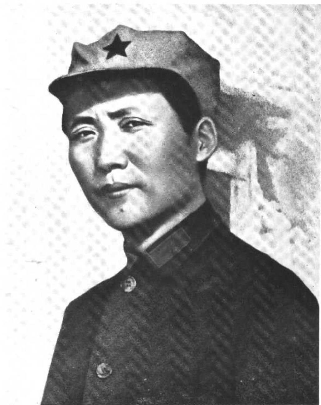
毛泽东同志在陕北(一九三六年)