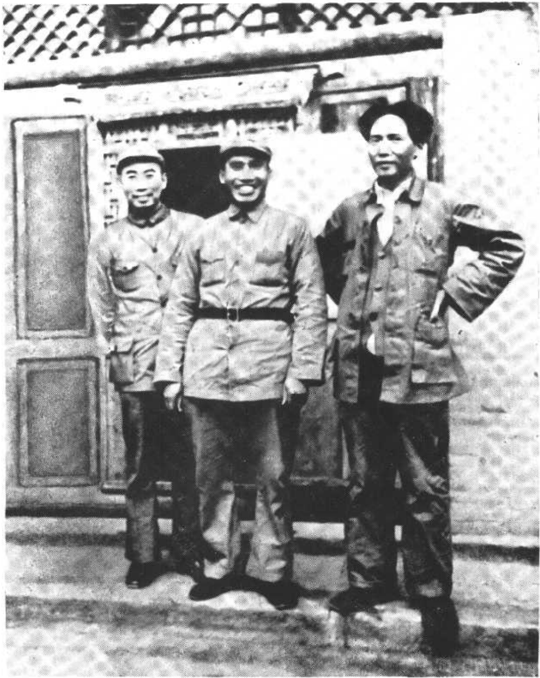
毛泽东和周恩来、朱德同志在长征胜利到达陕北后的合影