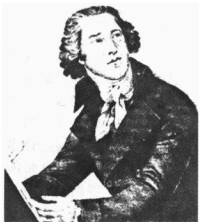
利奥波德·寇泽卢 (Leopold Kozeluh)

中，记载波希米亚人是德国甚至是全欧洲中最有音乐性的民族。他见到那儿的学校教导年轻的学童唱歌和演奏乐器，印象十分深刻。