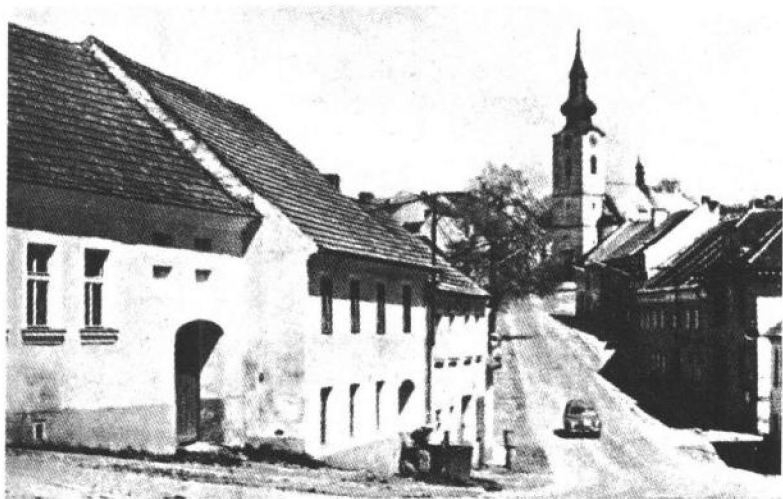
胡斯尼克(Husinec),伟大的宗教改革者扬·胡斯的诞生地