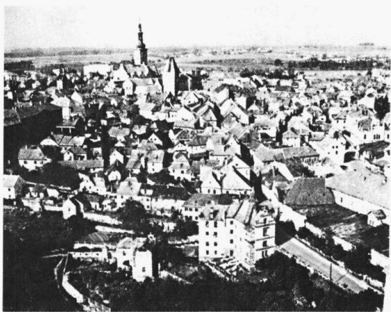
塔博尔, 胡斯教徒所拥有的根据地之一

年生) 也将这个曲调写入他的乐曲《布拉格, 1968 年》(Music for Prague 1968) 中, 作为捷克斯洛伐克近代危机中的一个反抗象征。