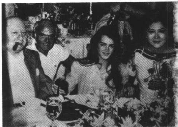
伊梅尔达与好莱坞电影明星波姬·小丝在一起