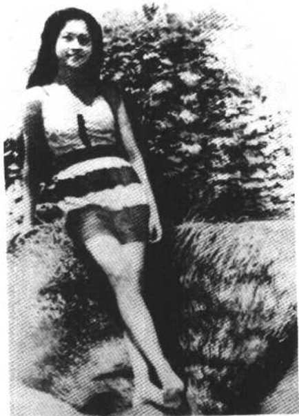
这是马科斯最喜欢的伊梅尔达少女时代的照片