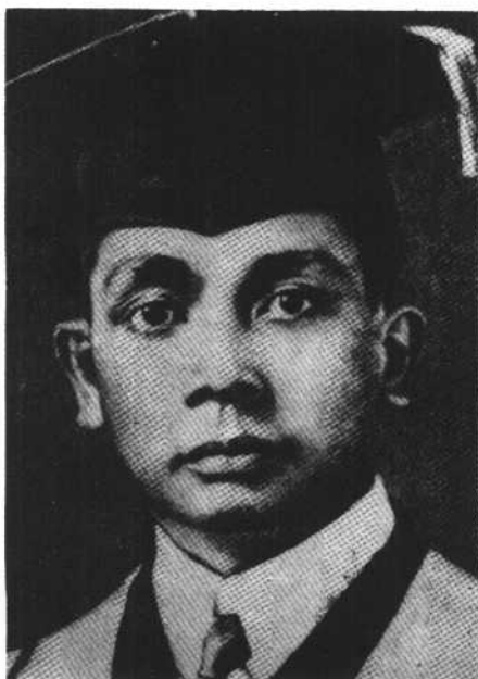
当教员时的马利亚诺· 马科斯