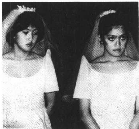
马科斯夫妇的爱女