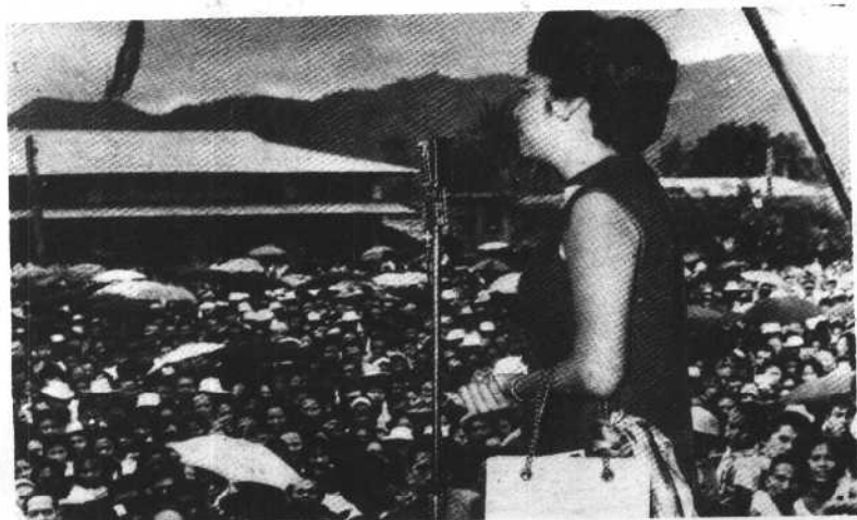
1965年总统大选前，伊梅尔达为马科斯助选