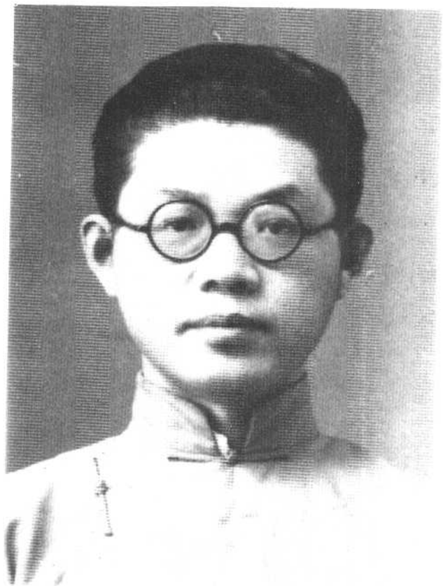
1936年在清华,这年写完《中国哲学大纲》初稿。