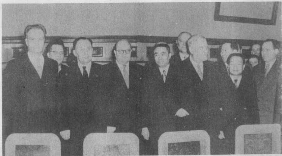
1954年朱学范（左5）访问苏联， 在莫斯科与苏联领导人合影。