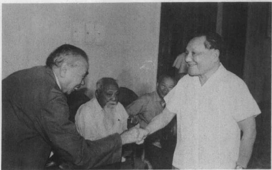
1982年8月29日邓小平在出席“缅怀廖仲恺、纪念何香凝逝世十周年大会”时和朱学范握手。