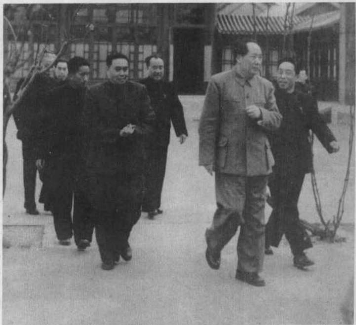
一九五六年四月朱学范(右四)和毛泽东、刘少奇、周恩来、朱德等领导同志在中南海。