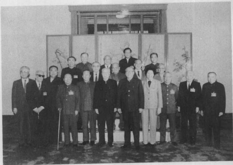
1988年第七届全国人大常委会委员长、 副委员长合影，前排右1为朱学范。