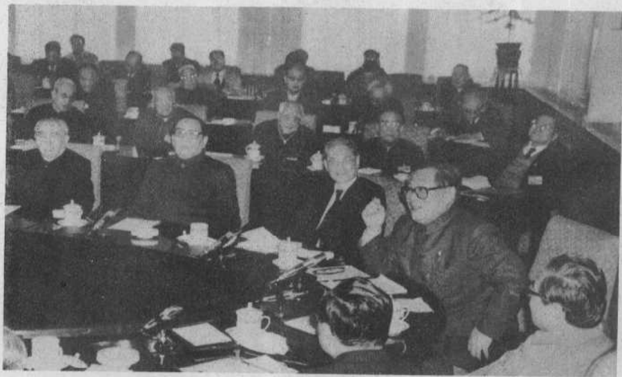
1990年3月19日朱学范（前排左1）出席了江泽民主持的中共中央召开的民主协商会。