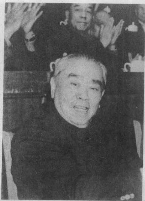
一九八一年十二月十三日朱学范在五届人大四次会议闭幕式上。这次会议补选朱学范为全国人大常委会副委员长。