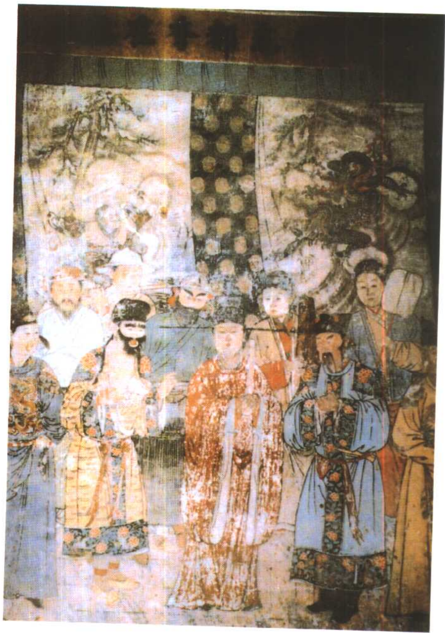
山西洪洞广胜寺元杂剧壁画