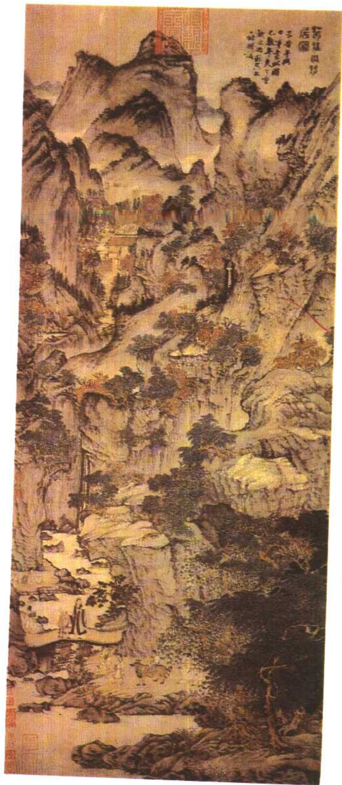
元王蒙《葛稚川移居图》