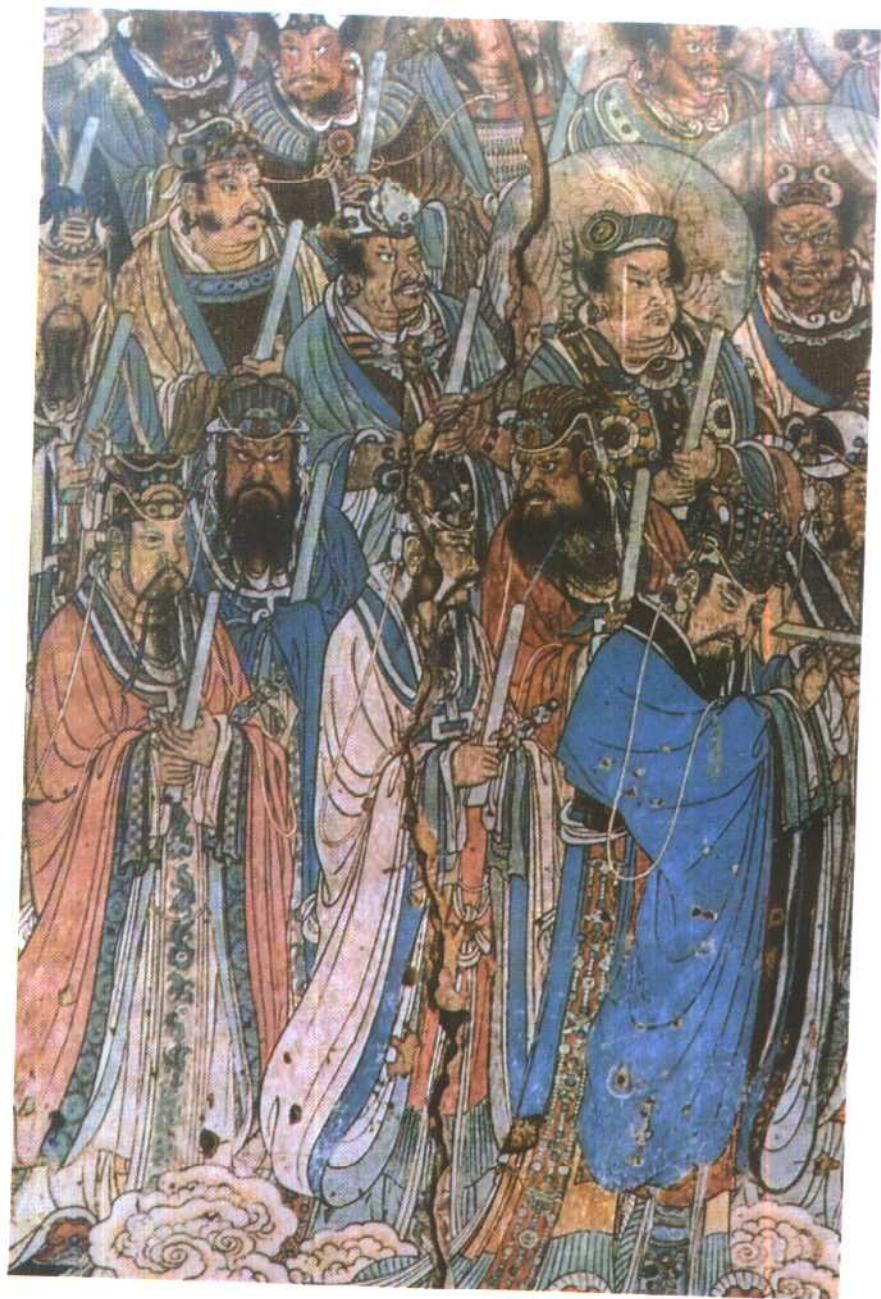
山西永济元纯阳万寿宫壁画