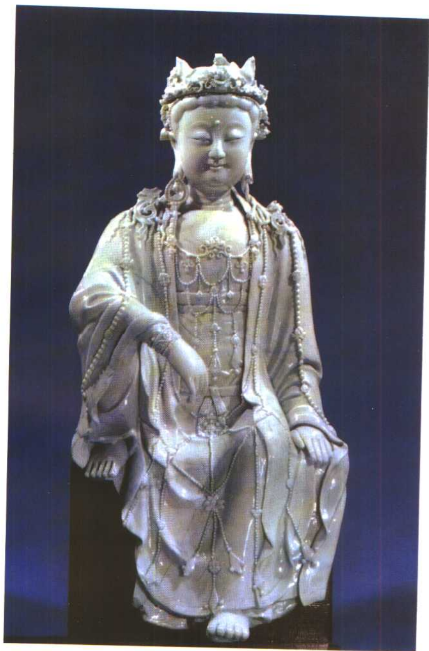
北京出土元影青观音像