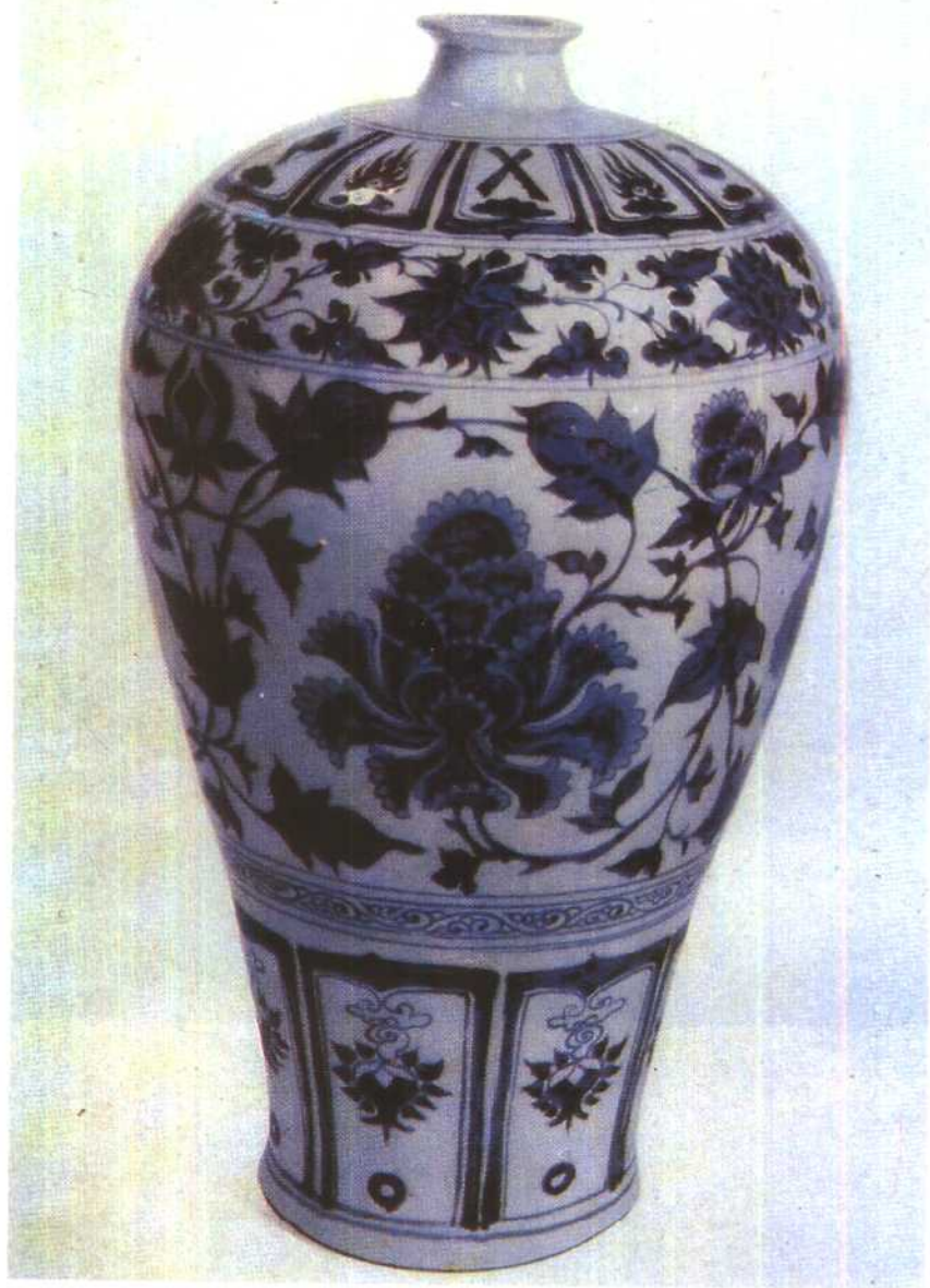
元景德镇窑青花瓶