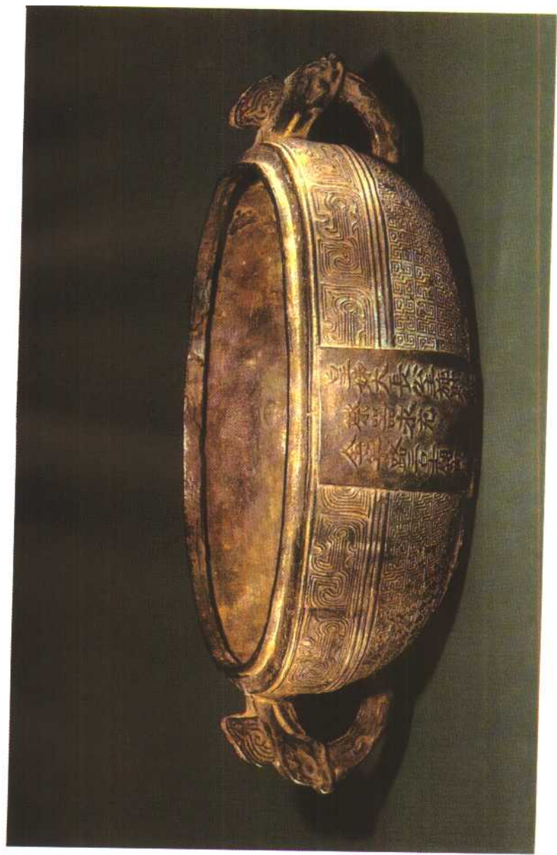
内蒙昭乌达盟出土元全宁路铜祭器