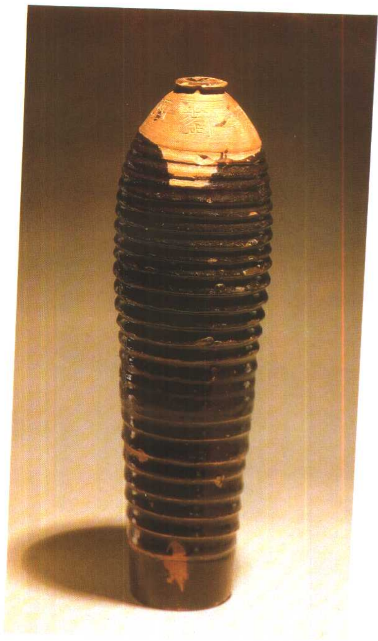
内蒙乌兰察布盟出土元黑釉葡萄酒瓶