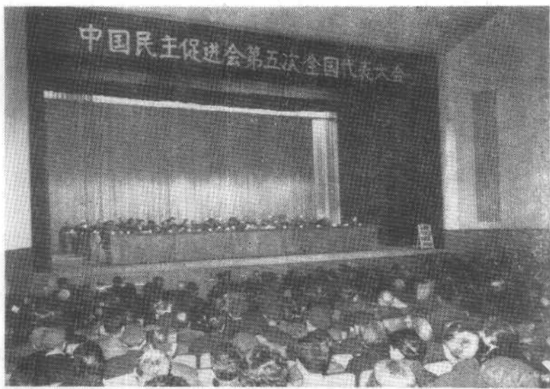
中国民主促进会第五次全国代表大会。（1983年12月）