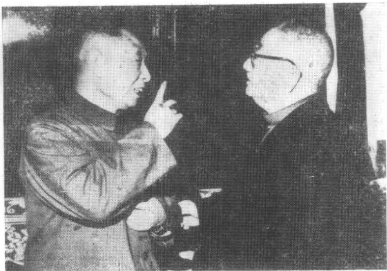
胡耀邦与周建人亲切交谈。(1979年10月)