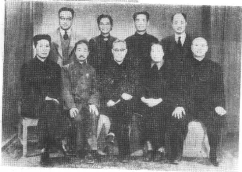
中国民主促进会参加中国人民政治协商会议第一届全体会议代表 合影。（前排左起：林汉达、周建人、马叙伦、许广平、王绍鏊；后排左起： 梅达君、雷洁琼、徐伯昕、严景耀）

1949年12月，中共中央 特派林伯渠到沈阳迎接民主人 士入关，周恩来亲笔写信给马 叙伦、许广平，欢迎他们到北平 共商国家大计。（靠老即马叙 伦，景宋即许广平。）