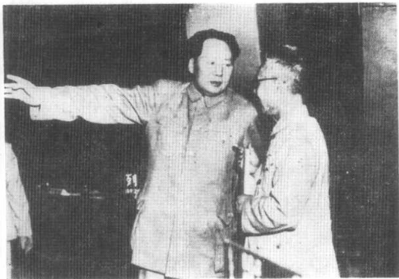
在开国大典上,毛泽东主席和马叙伦在亲切交谈。(1949年10月)