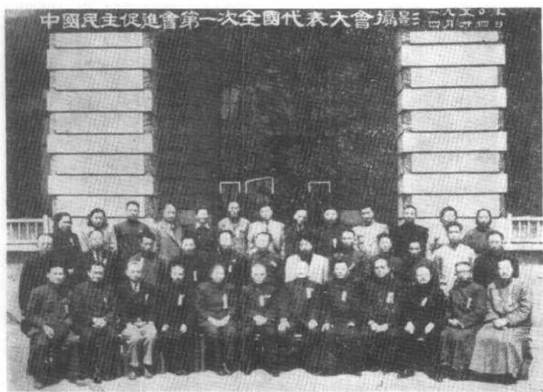
中国民主促进会第一次全国代表大会全体代表合影。(1950年4月)