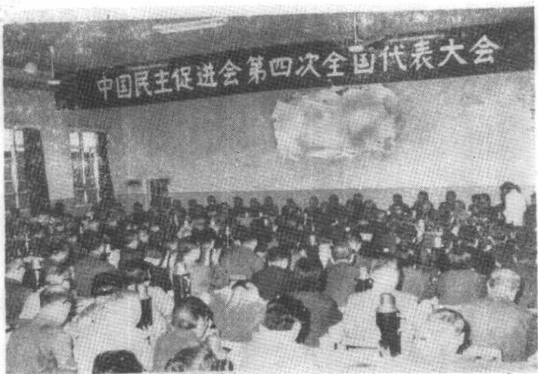
中国民主促进会在粉碎“四人帮”后召开了第四次全国代表大会。 (1979年10月)