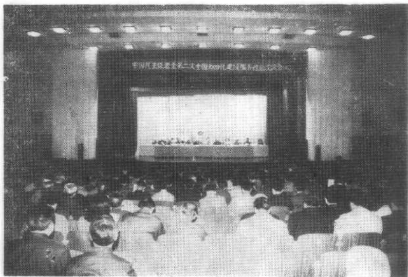
中国民主促进会第二次全国为四化建设服务经验交流会。(1985年5月)