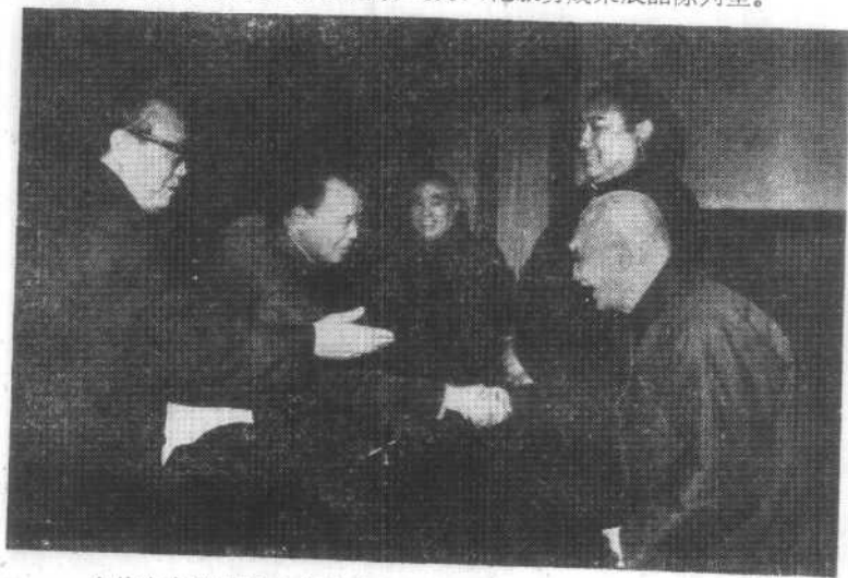
中共中央邀请民主党派人士座谈国家大事，赵紫阳总理和叶圣陶亲切握手。（1983年）