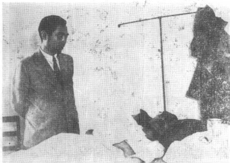
1946年6月23日南京“下关事件”发生后，中共代表周恩来等立即赶到医院看望被国民党特务暴徒殴打致重伤的马叙伦。