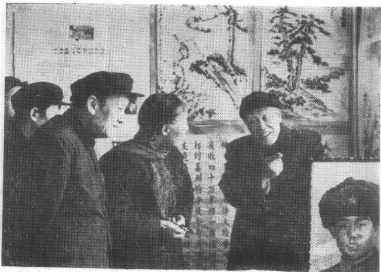
1980年12月，民进中央召开第一次全国为四化建设服务经验交流会。这是来宾在参观大会举办的为四化服务成果展品陈列室。