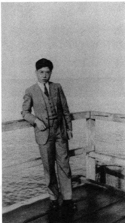
1932年夏，在德国东海吕根岛