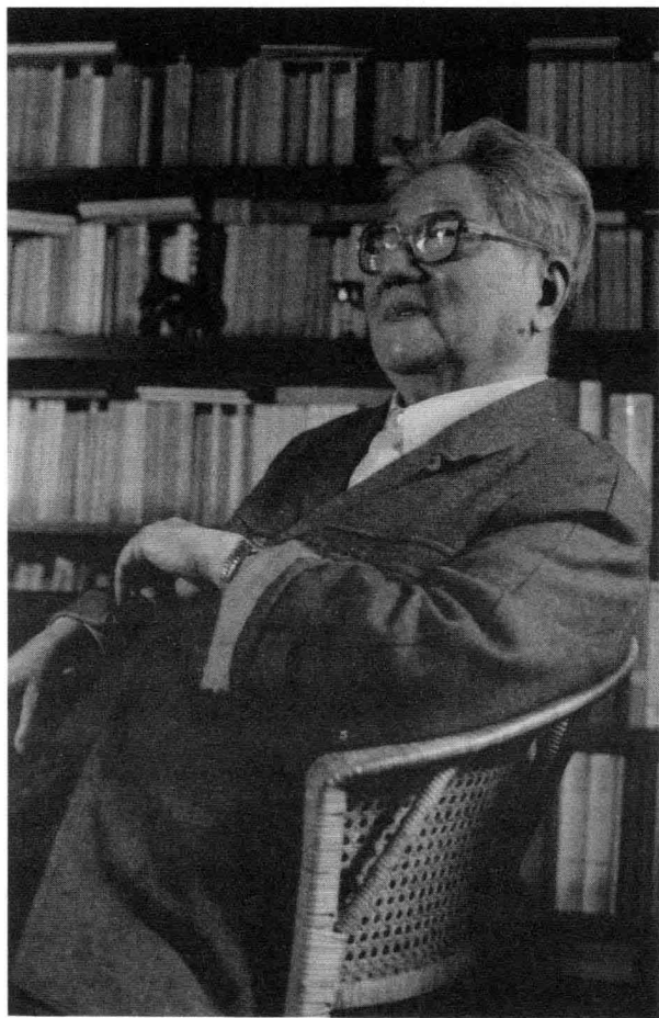
90年代初摄于永安南里家中