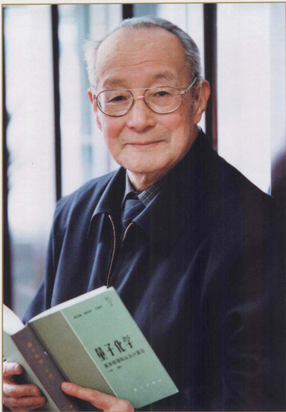
2003年1月22日徐光宪在北京大学化学学院办公室