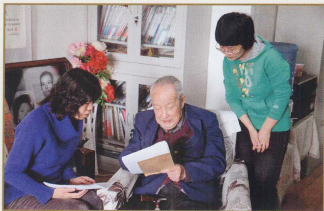
采集小组在访谈中