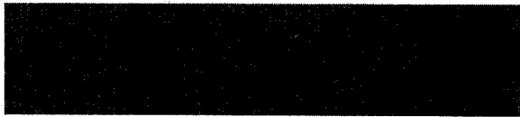
荷兰商业公司旗帜