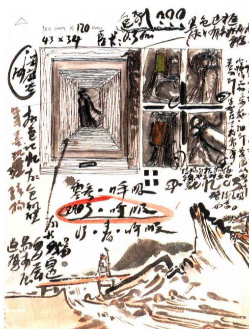
素描作品 / 王晓辉