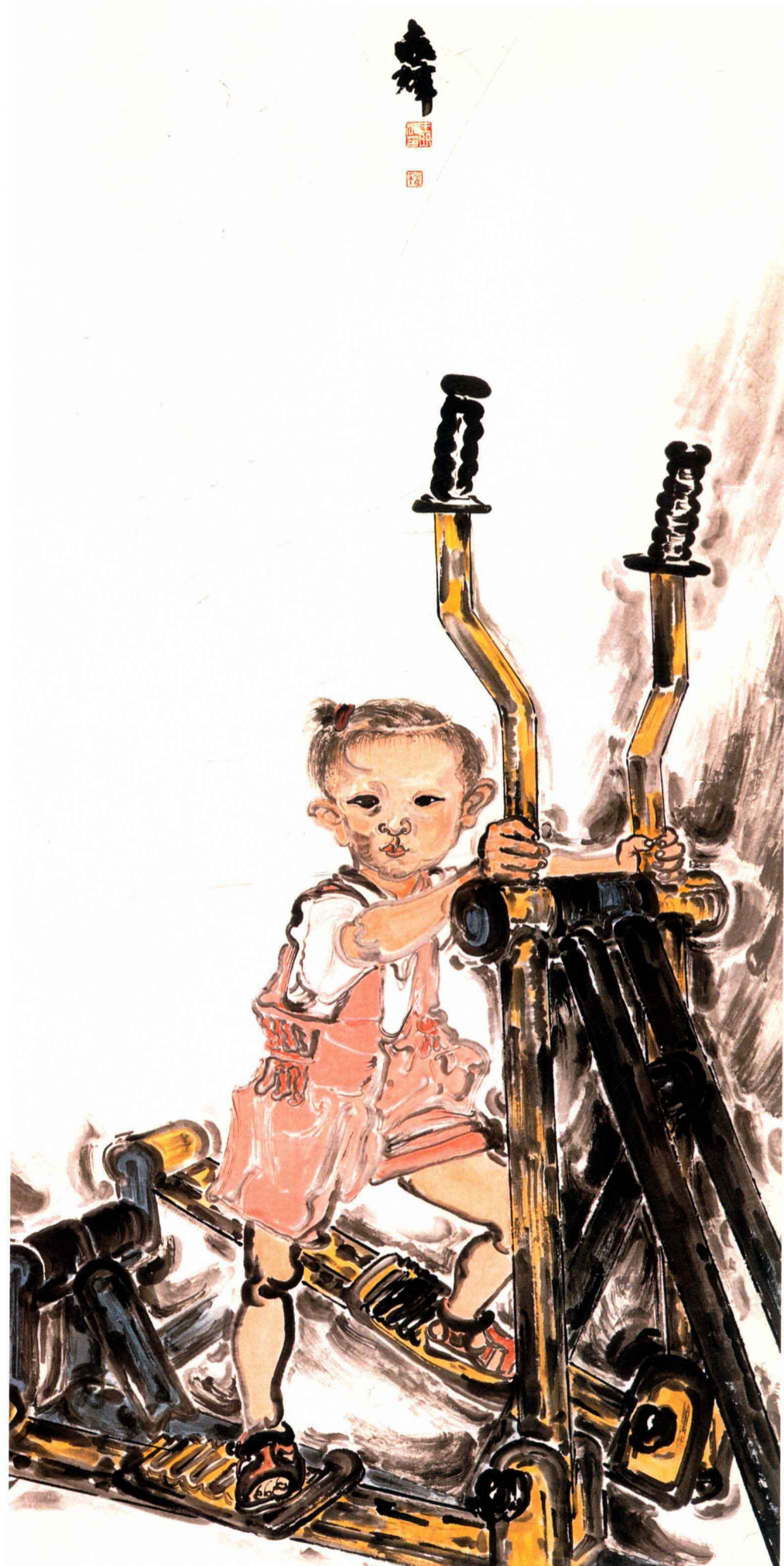
奔向 2008 之一 / 王晓辉