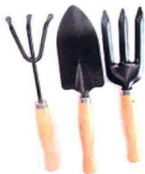
铁丝耙子 / 小花铲