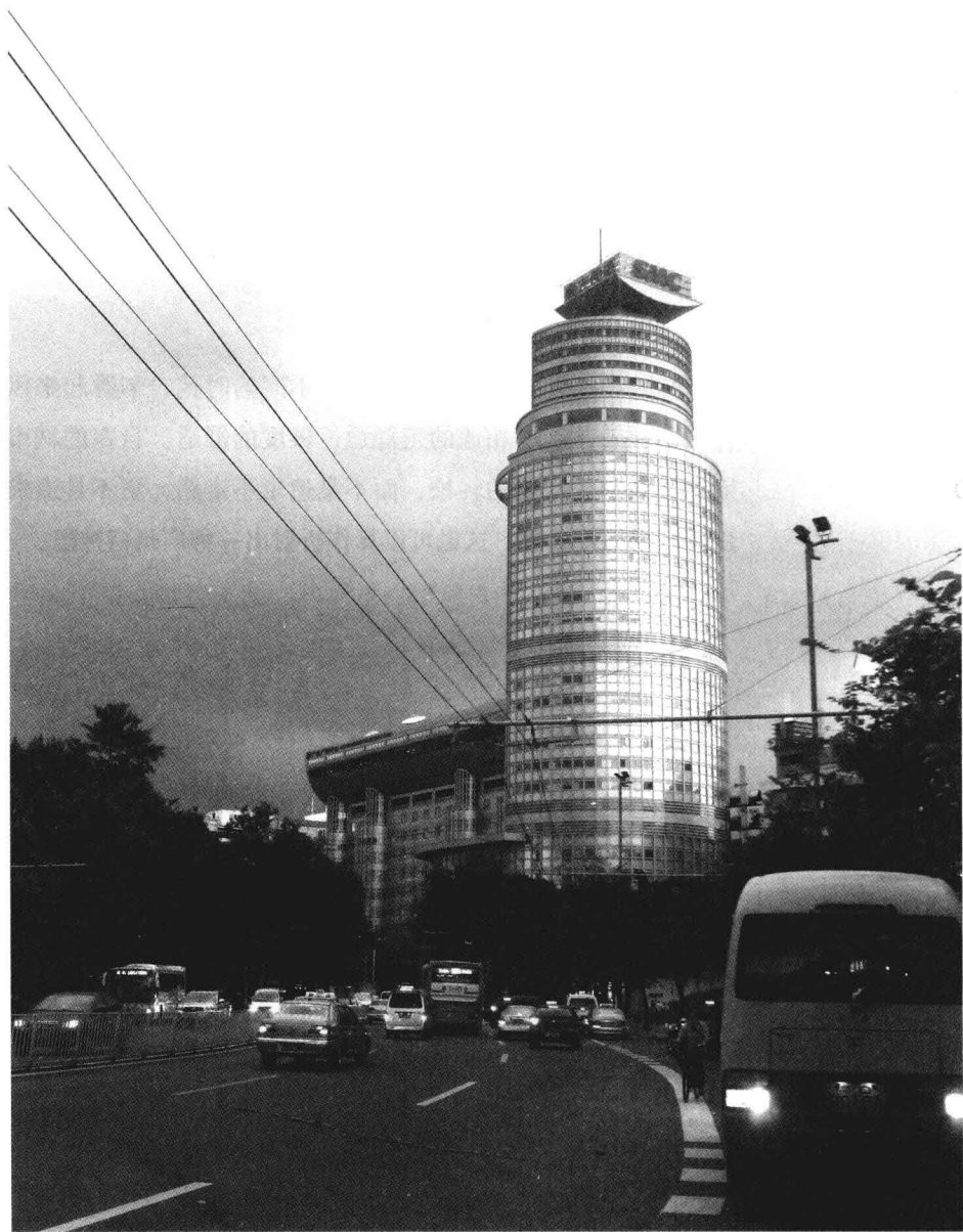
◎小时候想过钻进收音机里说话，没想到真的在电台干了大半辈子。广州人民北路686号，广东电台。2011年6月13日。LEICA D-LUX5。