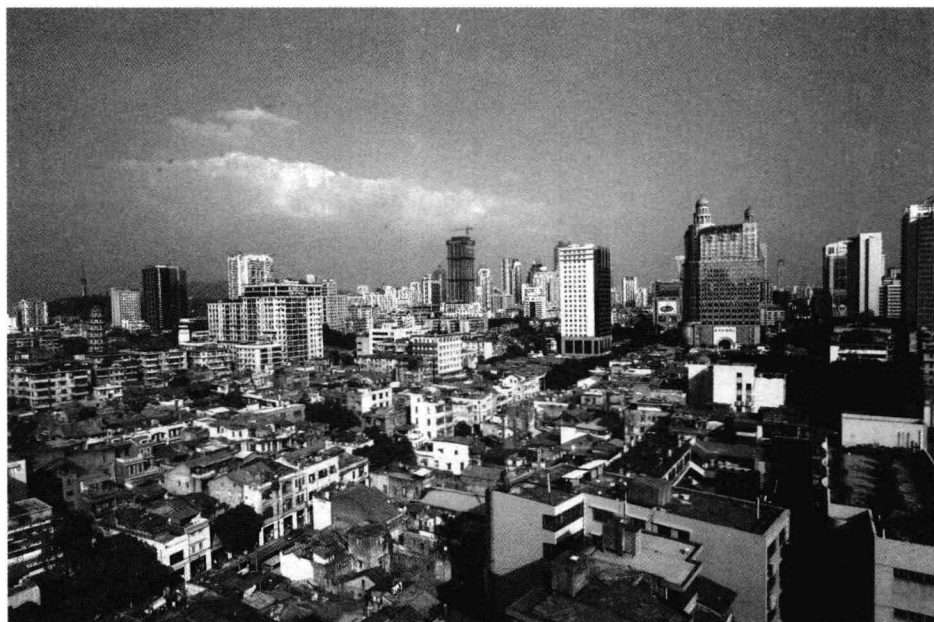
◎俯瞰老越秀区。所谓老广州的核心地带，是我生长的地方。拍于2008年12月。假如现在拍的话，很多房顶都变成橙色的尖顶玻璃钢了。佳能5D。