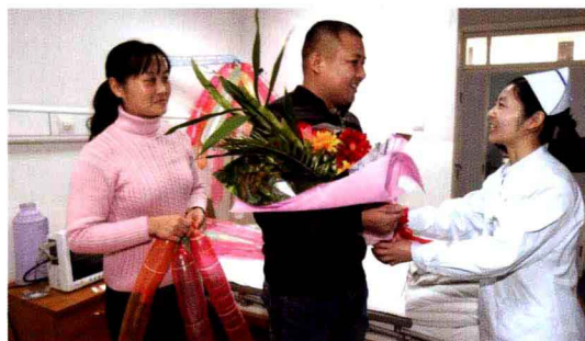
2009年12月我院呼吸内科在省内首次使用抗病毒血清成功救治甲流患者