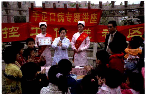
我院定期走进社区普及医学知识