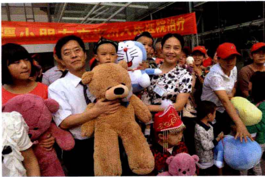
“送医五千里、爱心满哈密”，我院接收新疆先心病患儿来院诊治