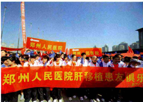
肝移植患者参加郑开国际马拉松比赛