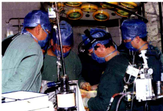
2000年9月我院完成第一例肾移植手术