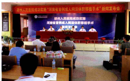
河南省首例成人间活体肝移植手术新闻发布会