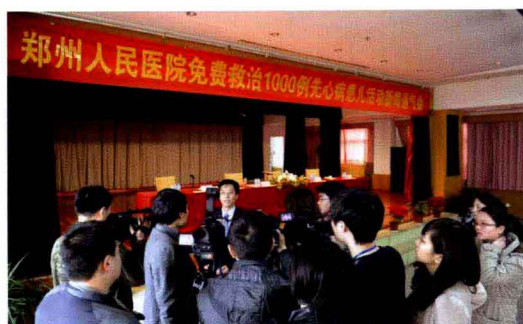
“免费救助千例先心病患儿”活动新闻通气会现场