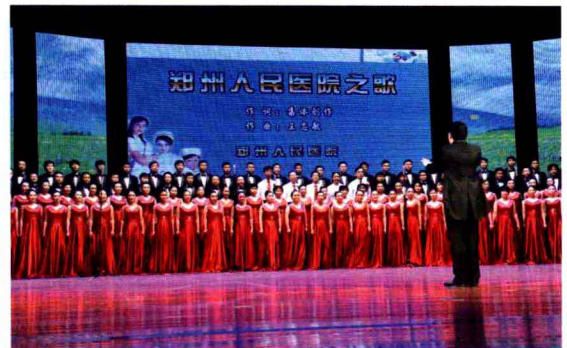
我院荣获河南省院歌比赛特等奖