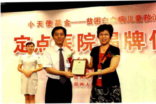
启动贫困白血病儿童救治活动，我院成为小天使基金定点医院