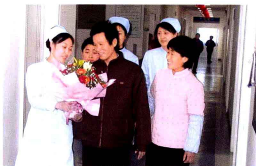
2007年我院完成第一例肝脏移植手术