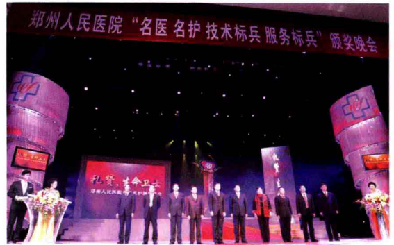
举办“名医名护、技术标兵、服务标兵”颁奖晚会