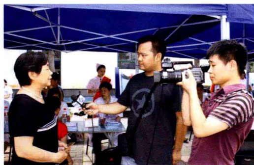
媒体对我院活动进行采访