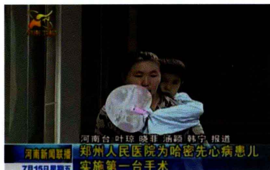
河南卫视对我院进行报道