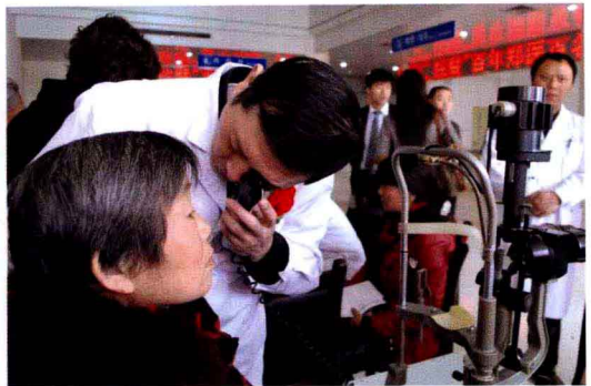
我院启动“百年郑医百名专家河南行”活动，定期到地市义诊