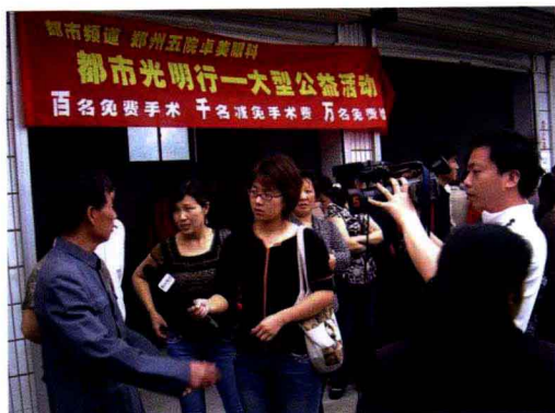
与媒体联合举办“都市光明行”活动，为广大贫困白内障患者带来光明