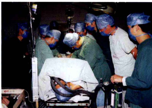
2000年11月我院完成第一例心脏搭桥手术