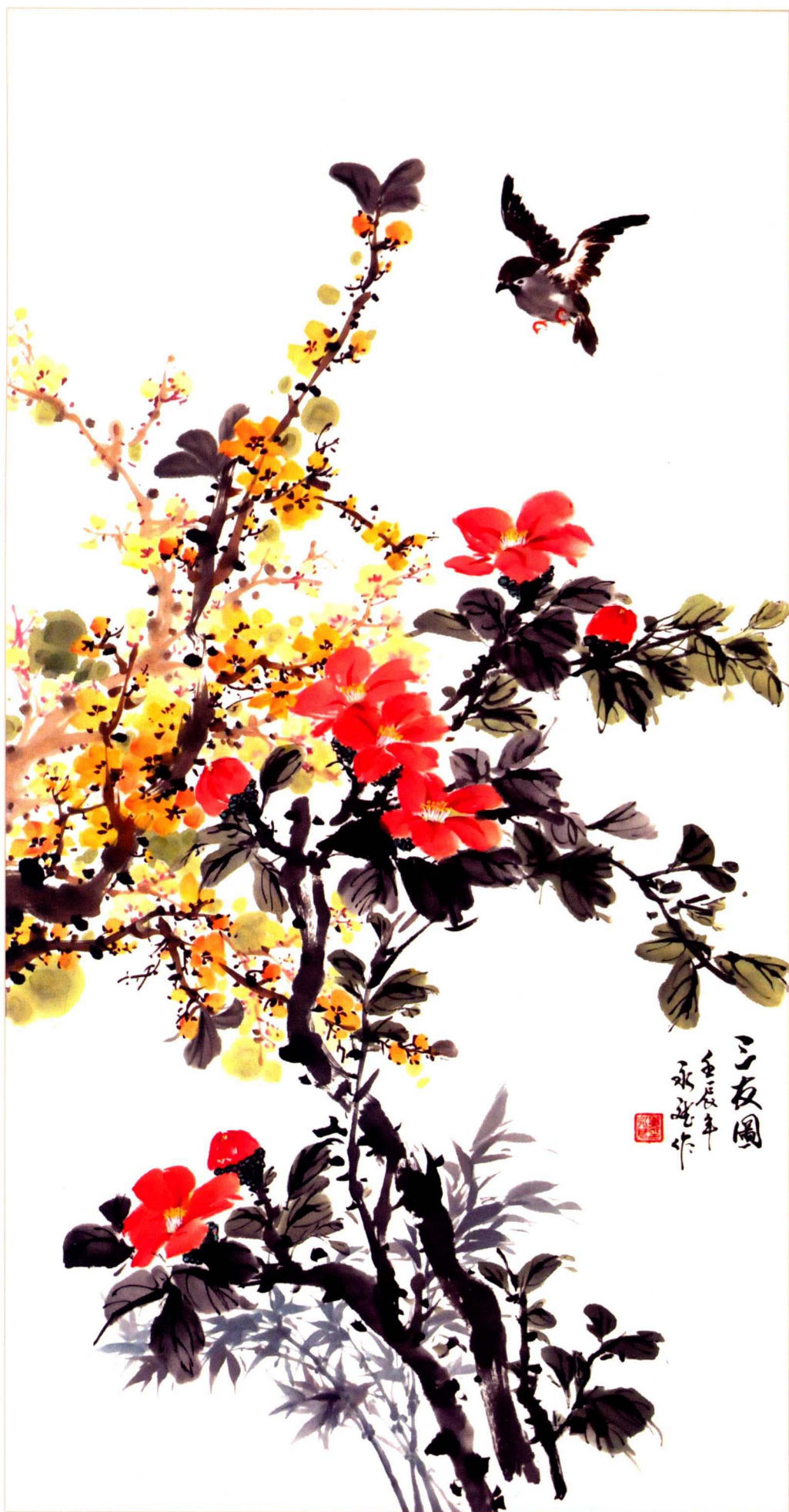
《三友圖》 98cm X 52cm