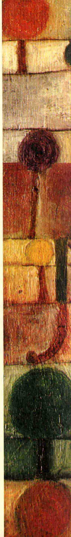
克利《在规律林景中的骆驼》1920