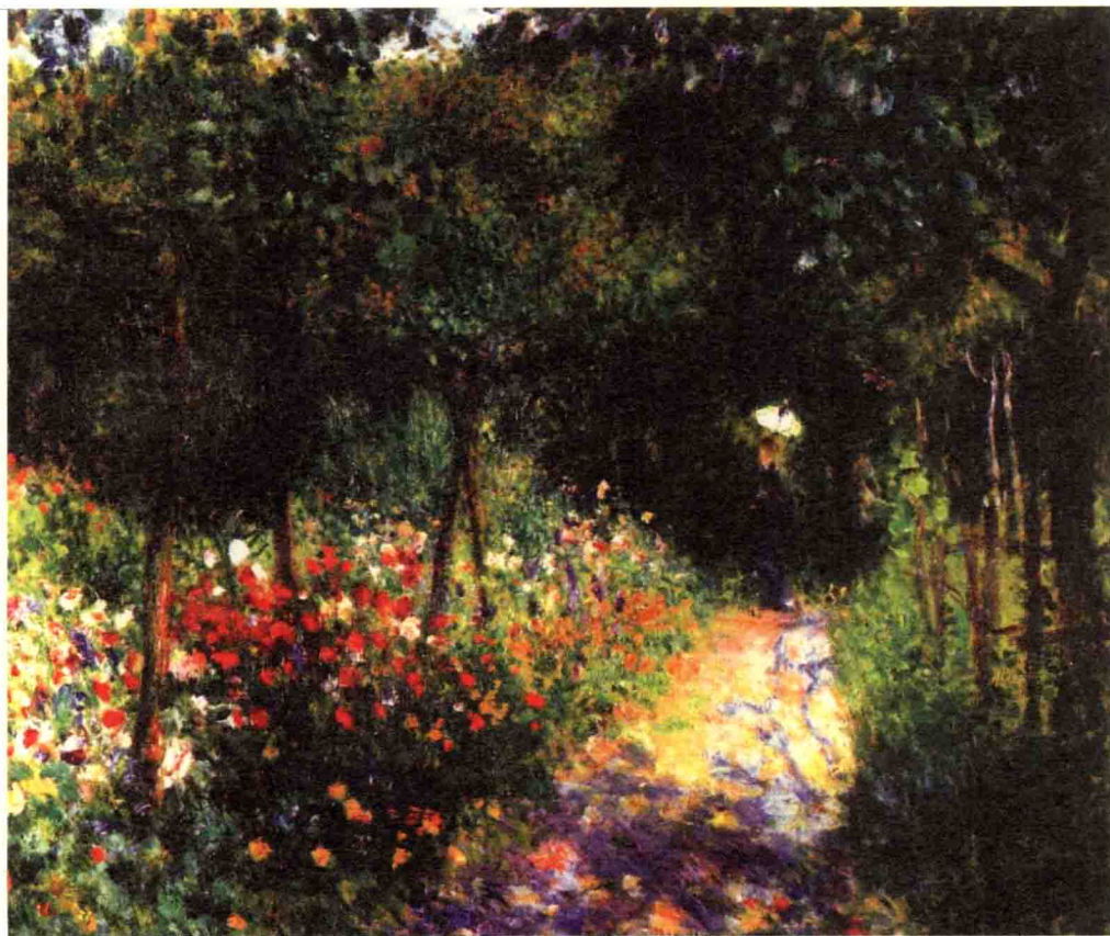
雷诺阿《花园中的女人》1873