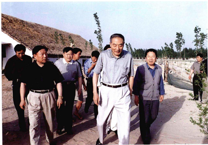
省九届人大常委会主任任克礼（前右二）莅尉检查指导工作，听取省公安厅驻村工作队“三个代表”学教活动工作汇报，视察尉氏县贾鲁河滩鱼鸭混养基地。