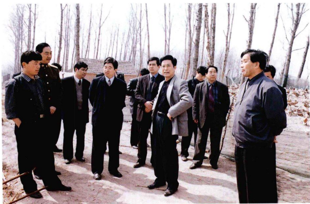
市委书记梁绪兴在县委书记乔心冰、县长吕明义等领导陪同下视察尉氏县贾鲁河滩鱼鸭混养基地。