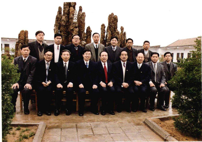
国务委员司马义·艾买提（中）来尉氏县视察民政工作，对敬老院建设给予高度评价，并与省、市、县有关领导合影留念。