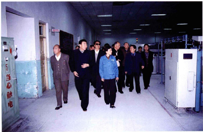
市十届人大常委会主任安哈美（前中）、副主任曹远谋、周嵩岳、化汉山在市人大常委会主任李顺海、副主任朱治卿、金喜明、张喜成的陪同下，视察尉氏县纺织有限公司。