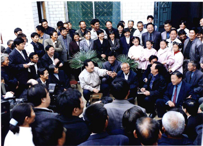
省委书记陈奎元在市、县有关领导的陪同下到尉氏县邢庄乡蜜蜂赵村看望省公安厅驻村工作队员和新村建设、调研驻村工作，并深入农户与村民交谈，了解群众的生产生活情况。