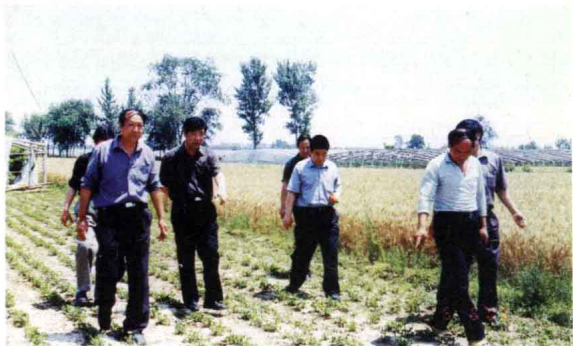
“信用社”的温室大棚硕果累累