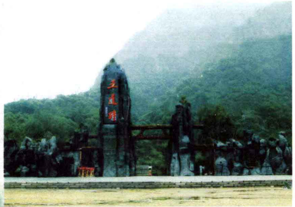
河南西峡五道碓生态游览区