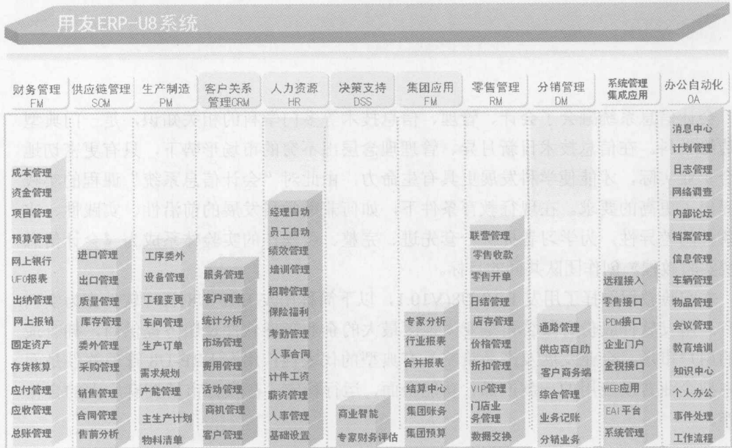
图 1-1 用友 ERP-U8 管理软件的总体结构

历经二十多年的发展，用友 ERP-U8 管理软件汇聚了几十万成功用户的应用需求，积累了丰富的行业先进企业管理经验，以销售订单为导向，以计划为主轴，其业务涵盖财务、物流、生产制造、CRM(客户关系管理)、OA(办公自动化)、管理会计、决策支持、网络分销、人力资源、集团应用，以及企业应用集成等全面应用，用友 ERP-U8 管理软件的总体结构如图 1-1 所示。