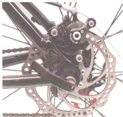
▲碟刹，通过夹器作闸固定在花鼓上的钢制盘片制动