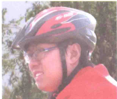
▲山地头盔：有帽檐，山地骑行时遮挡树枝