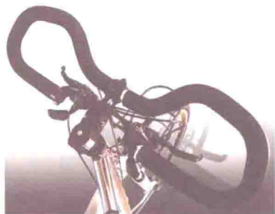
▲旅行车特有的蝴蝶把