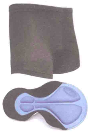
▲骑行裤内部有垫料，有效保护会阴部