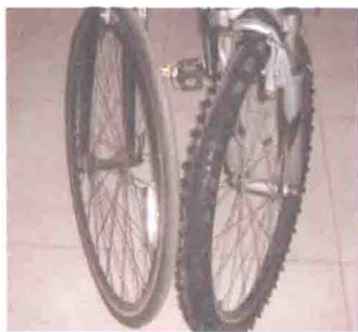
▲山地车胎(右)和公路车胎(左)对比