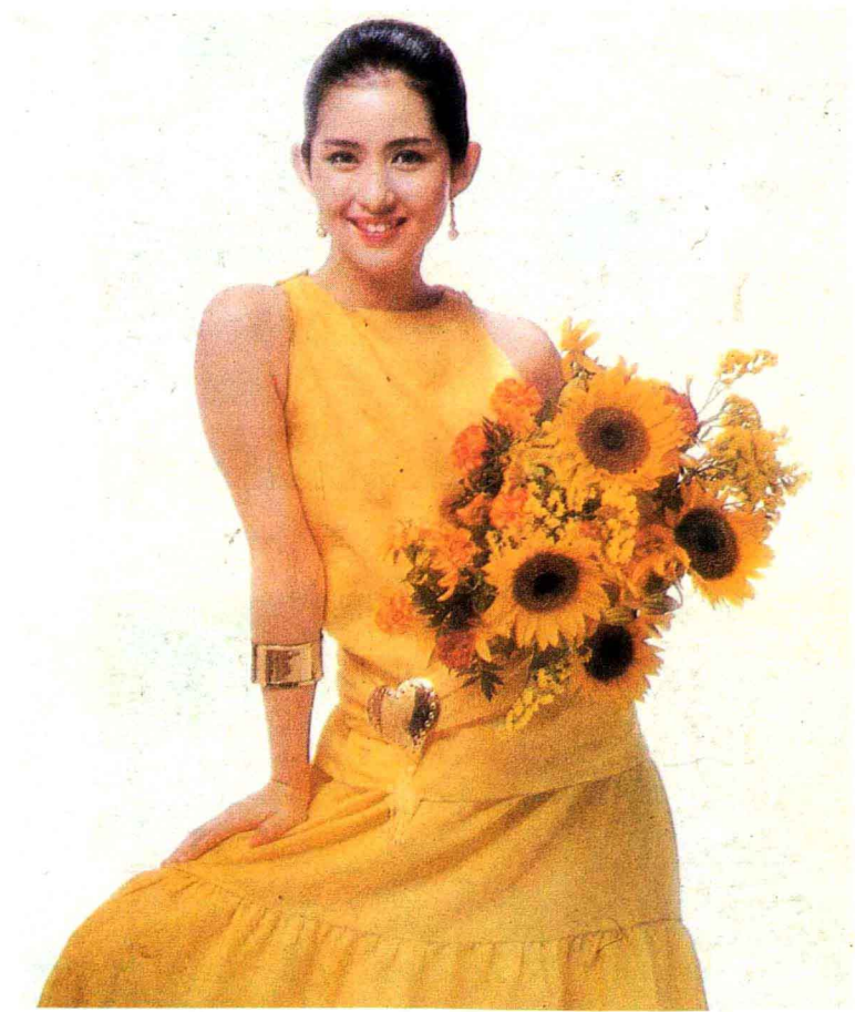
彩图十 黄调子使姑娘的肖像更带上了明快和幸福的情调。