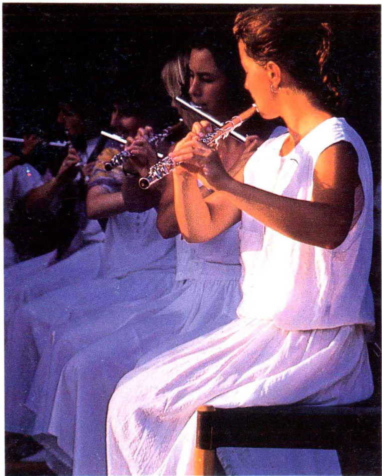
彩图三 亮色和暗色的对比使这位姑娘的衣服和肌肤质感得到了很好的表现。