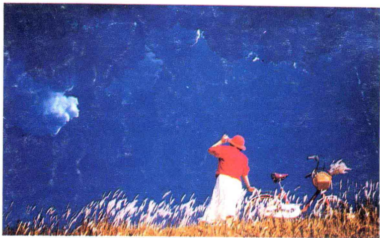
彩图十二 偏振镜压暗了天空,消除了反光。