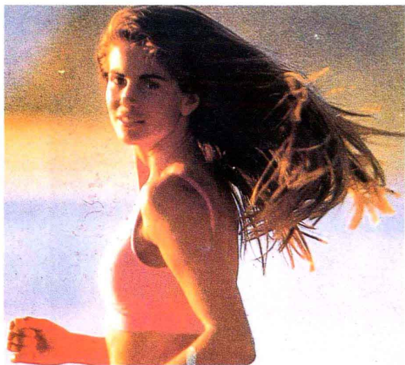
彩图七 阳光和阴影部分色彩的冷暖对比使画面色彩非常丰富。