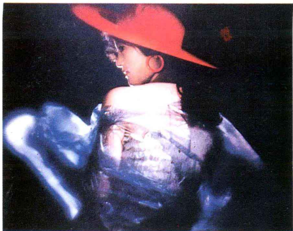
彩图六 在大面积的冷色中，一顶红帽子分外鲜明。