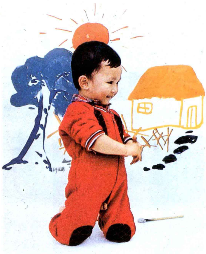
彩图四 色彩间的对比使儿童充分显现了个性。