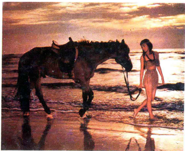
彩图十一 套用了橙色滤镜使黄昏富有诗意。