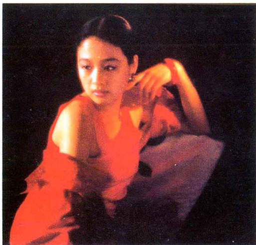
彩图五 穿红色衣服的女孩在黑色的背景前分外突出。