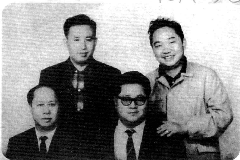
左上 卧龙生，前右 诸葛青云，右上 古龙。