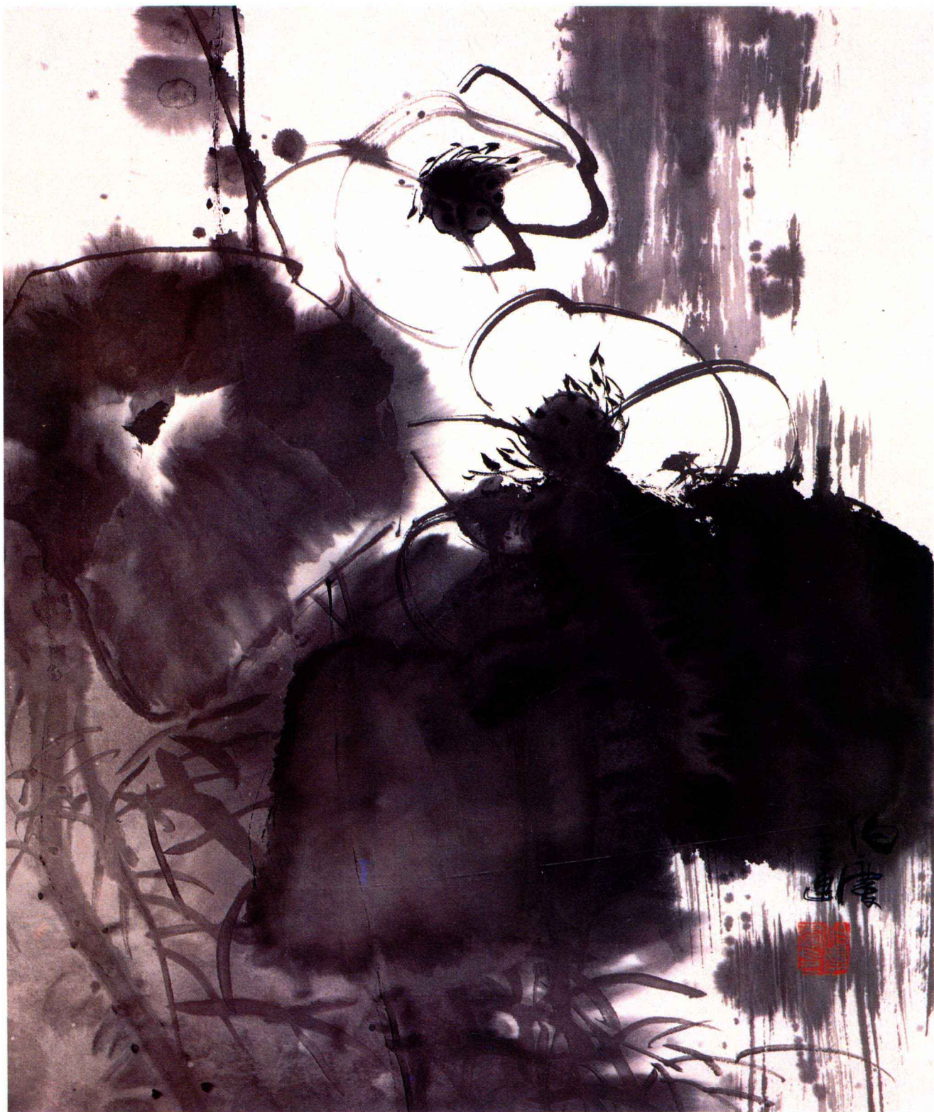
② 墨荷 42cm×35cm