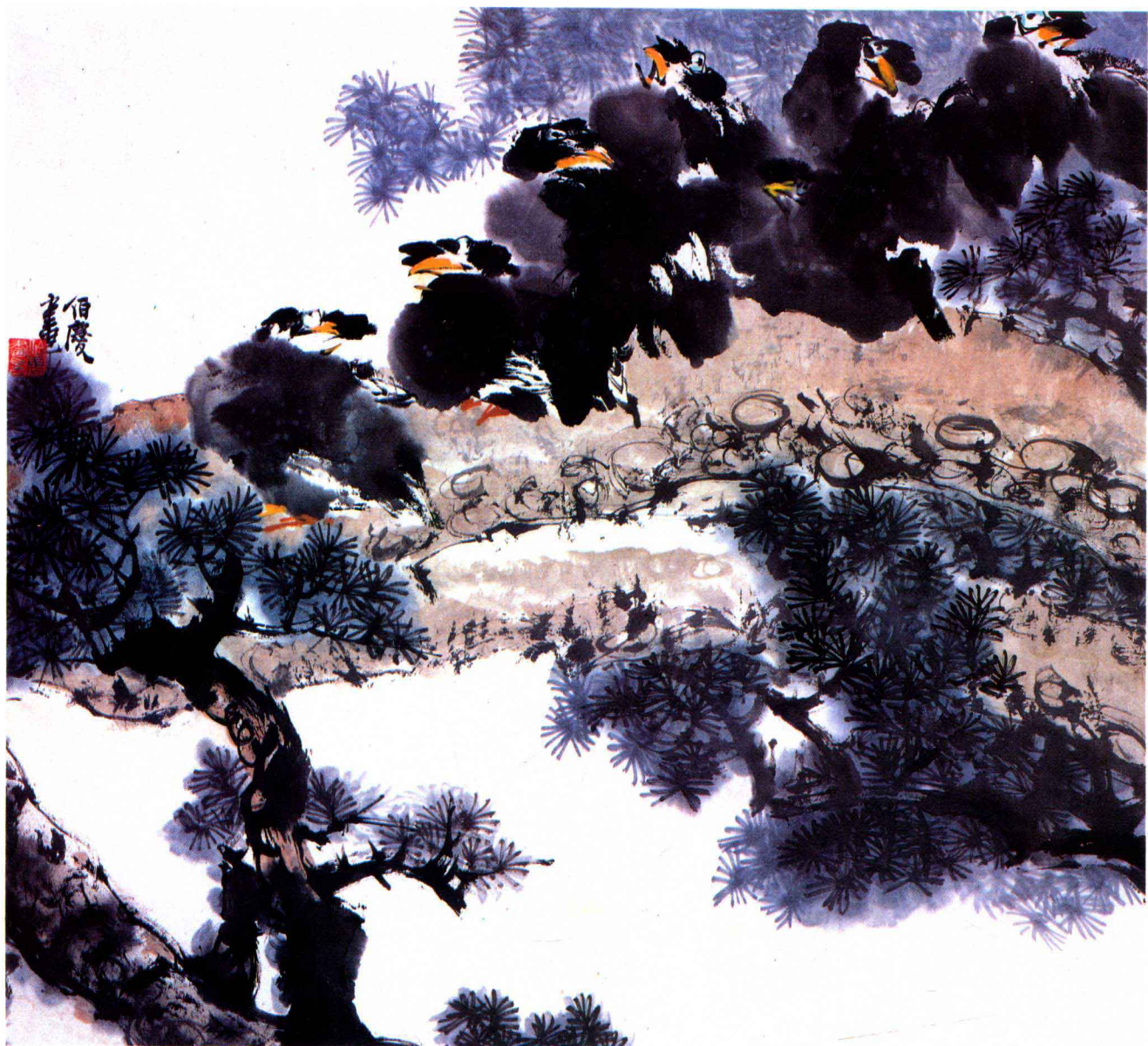
⑥ 群棲 55.5cm×61.5cm