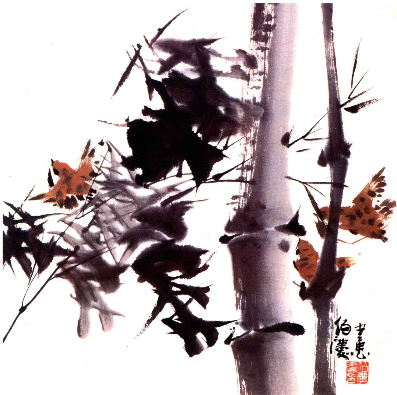
⑤ 乐在清风中 35cm × 34.5cm