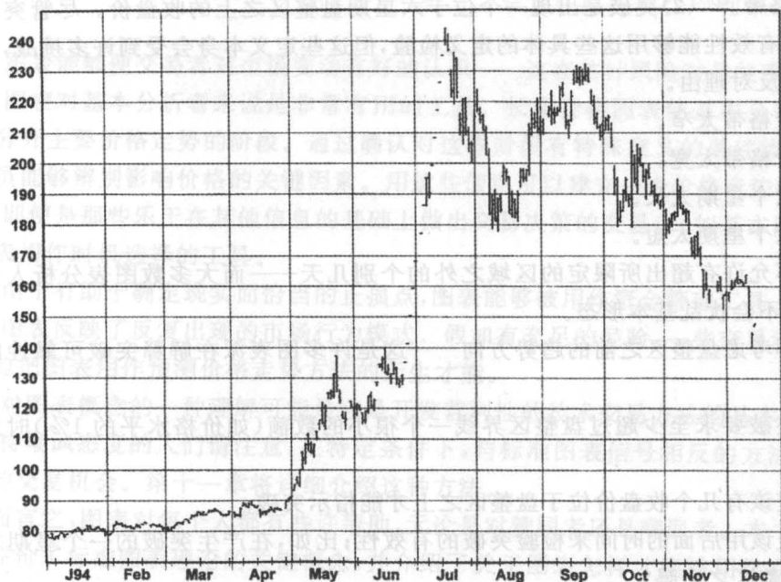
图 1.2 1994 年 12 月 咖啡