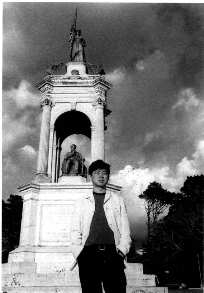
在美国加州大学伯克利分校从事历史研究 时摄于旧金山 2006年