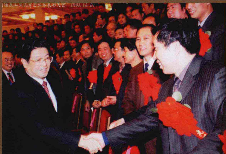
中共中央政治局委员、全国人大副委员长王兆国(左一)与义煤集团董事长、党委书记付永水亲切握手