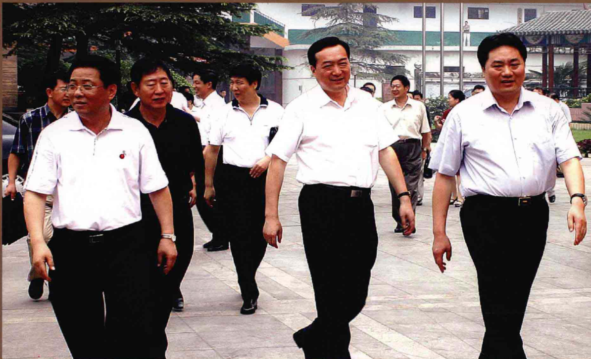
省委副书记陈全国(右二)在郑煤集团视察工作