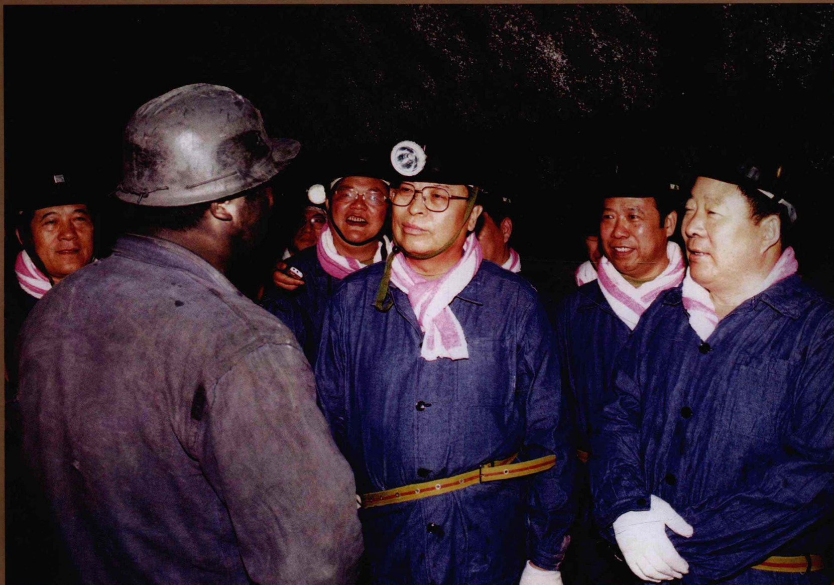
省委书记徐光春（右三）由省煤炭局党组书记、局长李恩东（右一）陪同视察焦煤集团