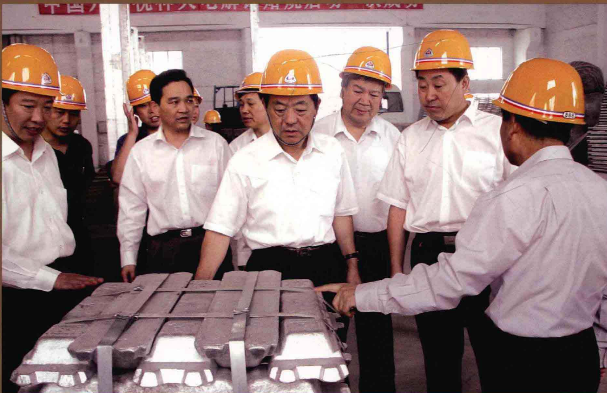
省政协主席王全书(左三)在神火集团视察工作