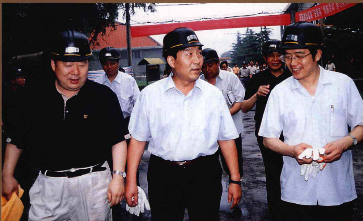
副省长史济春(中)由省煤炭局党组书记、局长李恩东（左一）陪同视察鹤煤集团