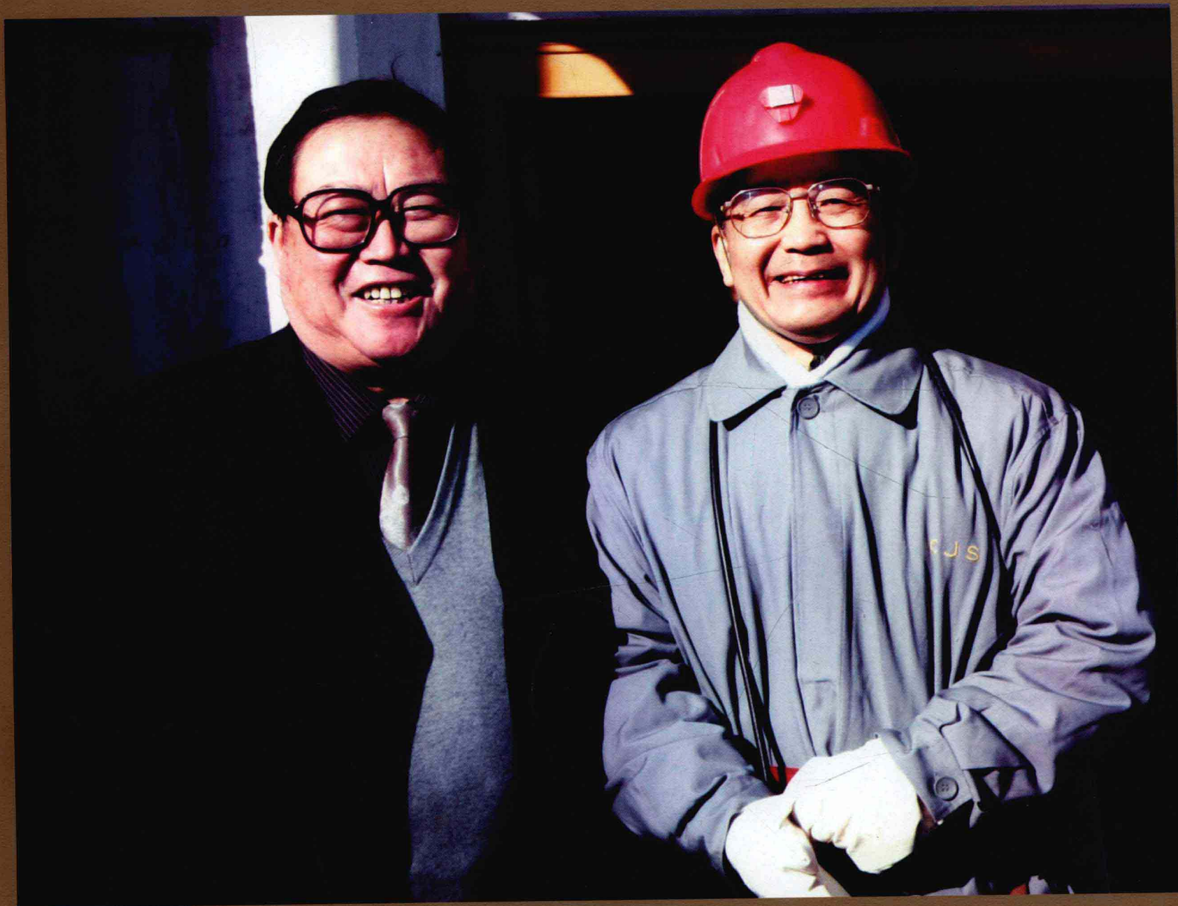
国务院总理温家宝与中国工程院院士张铁岗在一起