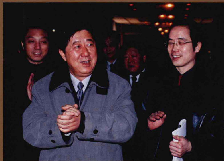
国家安全生产监察局副局长王显政(左一)在鹤煤集团视察工作