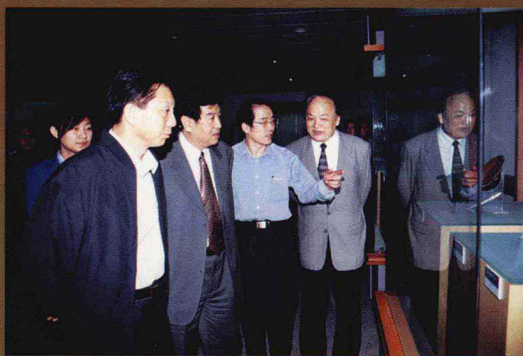
全国政协副主席李蒙(右一)视察鹤煤集团