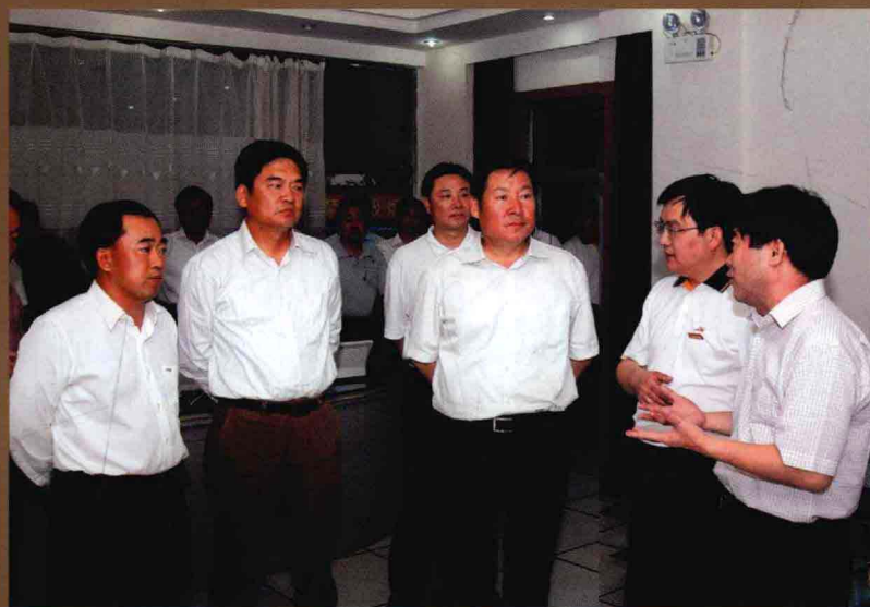
国家煤矿安全监察局局长赵铁锤(中)视察平煤集团