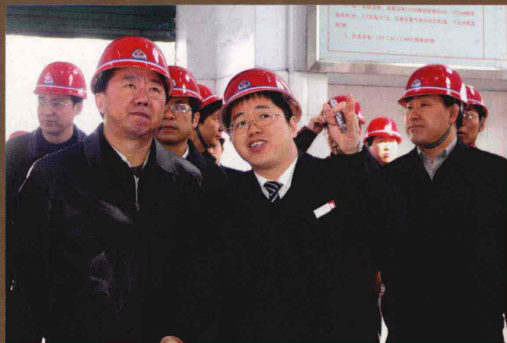
中央政策研究室副主任何毅亭（左一）到永煤集团视察