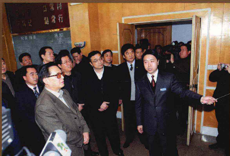
国务委员兼国务院秘书长华建敏(左二)视察平煤集团