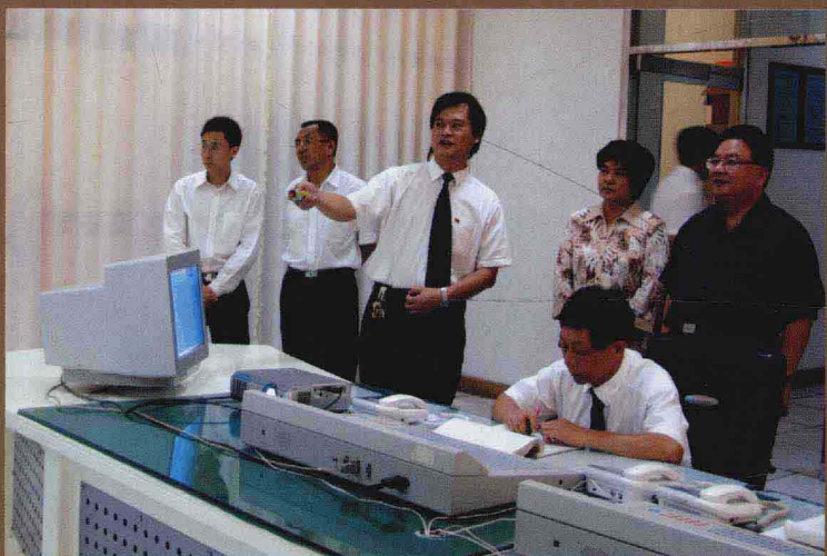
我国驻巴西大使蒋元德（右一）一行视察永煤集团