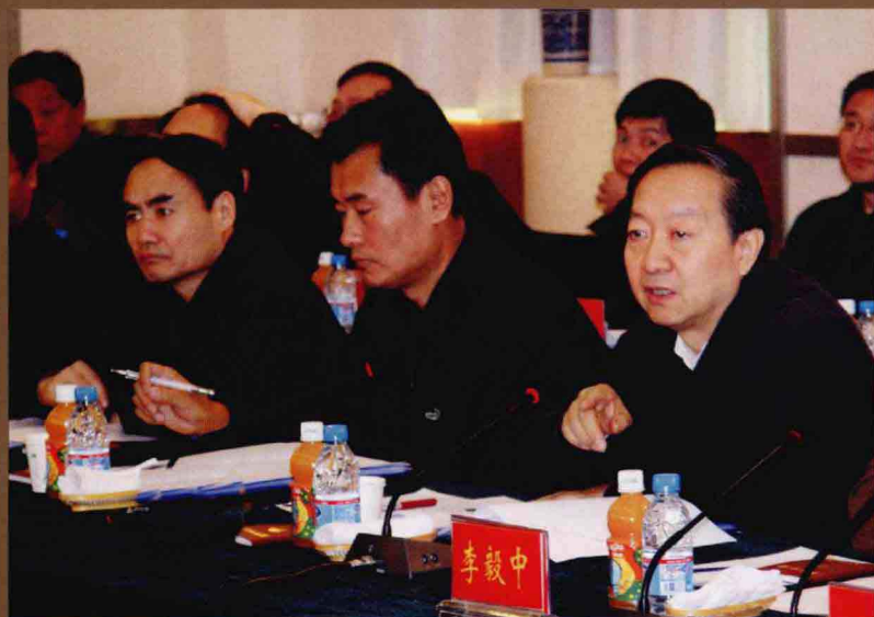
国家安全生产监察局局长李毅中(右一)在义煤集团视察工作