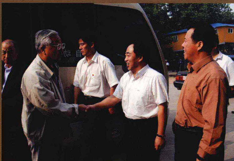
全国政协副主席张思卿(左一)视察平煤集团