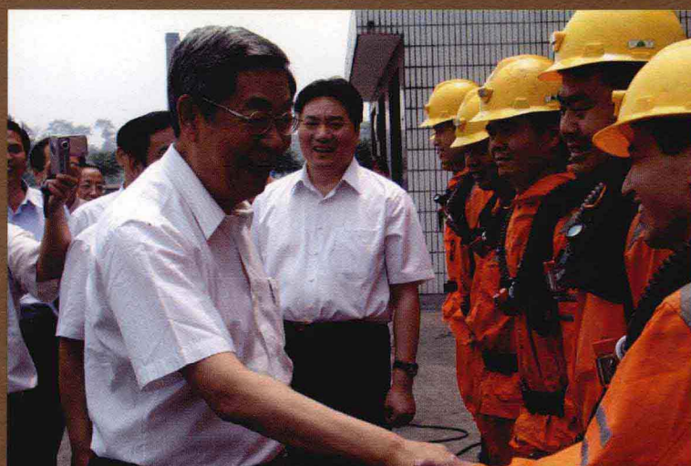
全国人大副委员长许嘉璐(左一)在郑煤集团视察工作