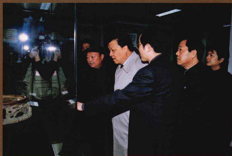
中共中央政治局委员、中宣部部长刘云山(右四)视察鹤煤集团