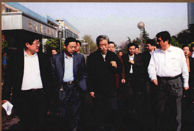
国家发改委能源办副主任马富才（中）到平煤六矿调研